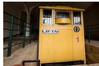
Žaliakalnio funikulierius