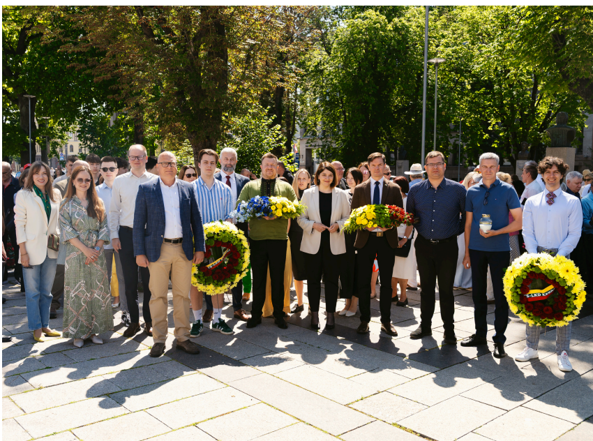
Karaliaus Mindaugo karūnavimo diena