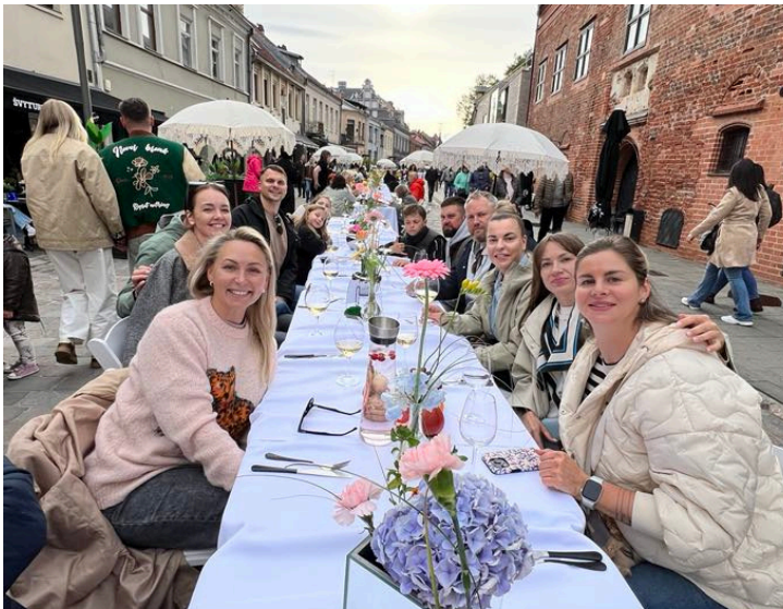
Kauno gimtadienio vakarienė