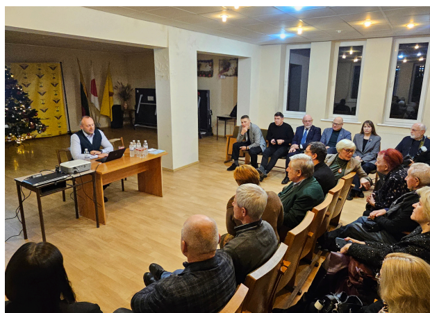
Aleksoto plėtros forumė