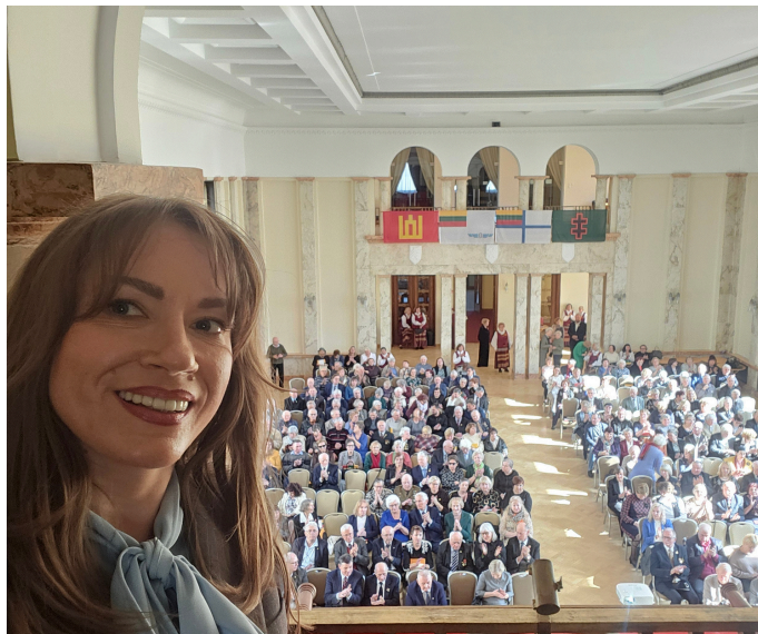
Lietuvos politinių kalinių ir tremtinių sąjungos suvažiavime

Siekdama užtikrinti grįžtamąjį ryšį, dalyvavau susitikimuose su gyventojais, bendruomenių ir organizacijų renginiuose. Tai padėjo geriau pažinti miestelėnų poreikius ir stiprinti tarpusavio pasitikėjimą.