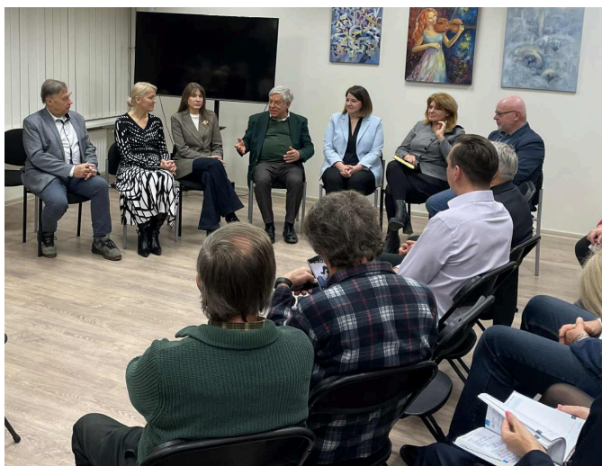
Panemunės bendruomenės renginyje „Pokalbiai apie Lietuvą“