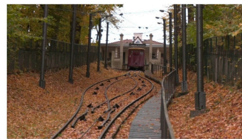
LNK stop kadras

Opozicija kritikuoja – funikulieriui, kaip svarbiam kultūros objektui, skiriama per mažai dėmesio.