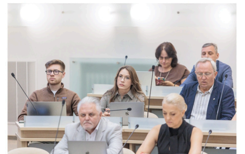
KAUNO MIESTO TARYBOS POSĖDIS