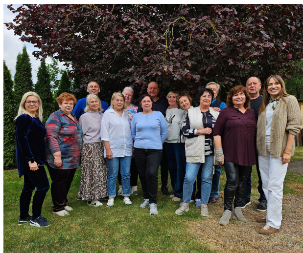
Romainių bendruomenės centro kaimynų dienoje