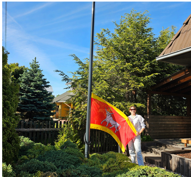
Ruošiantis kaimynų dienas