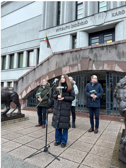
Plačiau apie 2025 akciją „Neužmirštuolių pieva“

„Neužmirštuolių pieva“, Vytauto Didžiojo Karo muziejaus sodelyje, skirtą pagerbti žuvusius sausio 13-ąją, „Uždek žvakutę savo krašto partizanams“, artėjant Vėlinėms skirtą prisiminti mūsų Laisvės kovotojus. Beį kartu su kolegomis - „Uždek žvakutę žuvusiems Ukrainos Laisvės gynėjams“.