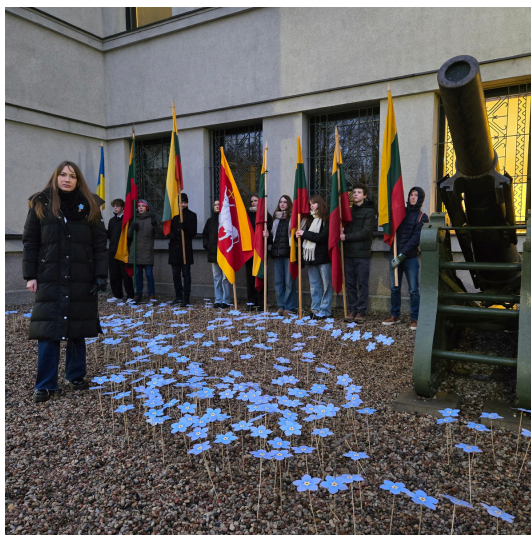
Plačiau apie 2025 akciją Ukrainos Laisvės gynėjams