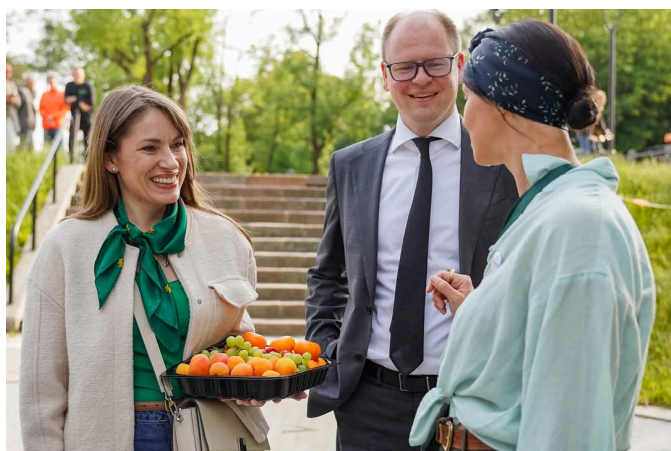
Žaliakalnio šventėje „Čia mūsų kiemas“