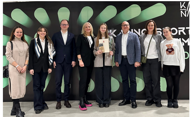
Kauno sporto apdovanojimai