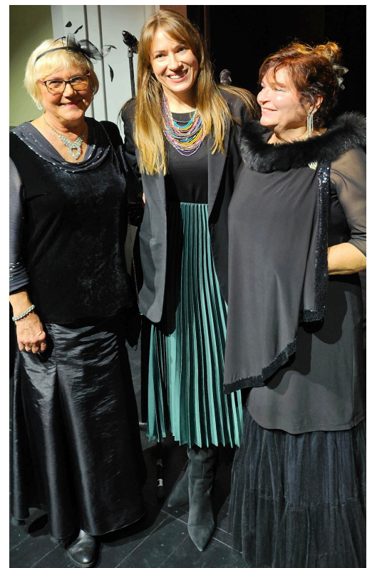
Kauno bendruomenių centrų asociacijos romantinės dainos festivalyje „Neklausk meilės vardo“