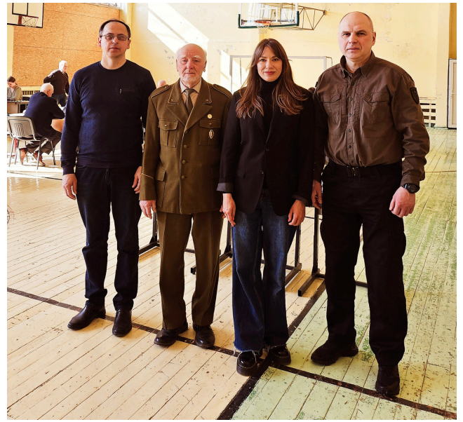
Šaškių turnyre legendiniam partizanui Juozui Lukšai-Daumantui atminti Gen. P. Plechavičiaus kadetų licėjuje