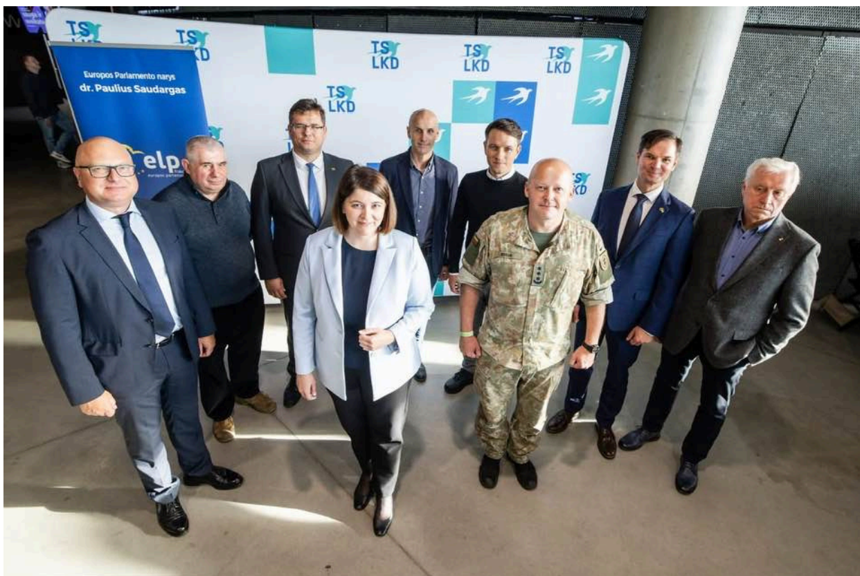
Akimirkos iš Kauno inovacijų ir gynybos pramonės forumo

Kauno miesto administracijos ir tarybos vaidmuo - čia taip pat kertinis. Miestas turi būti pasiruošęs įgyvendinti šią viziją. Mūsų kaip opozicijos tikslas - įtikinti, kad ši perspektyva Kaunui atneštų kito lygio galimybes.