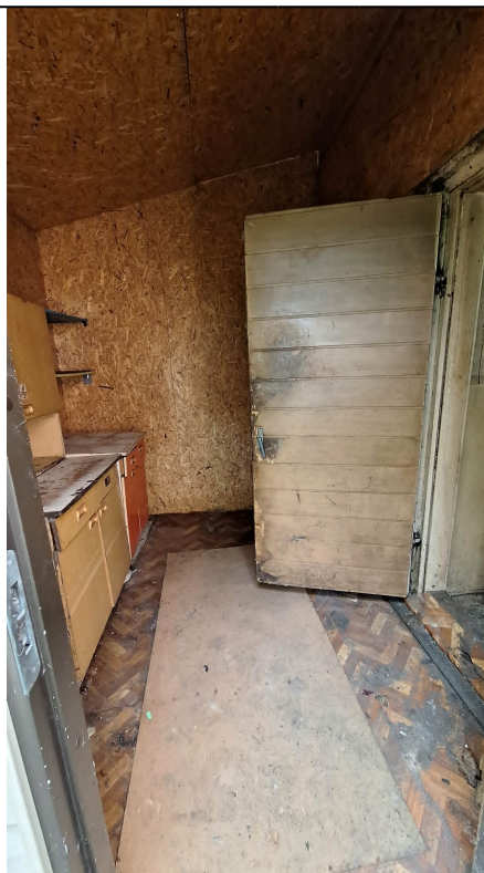
Nr. 4 Pavadinimas Vidaus patalpų fragmentai