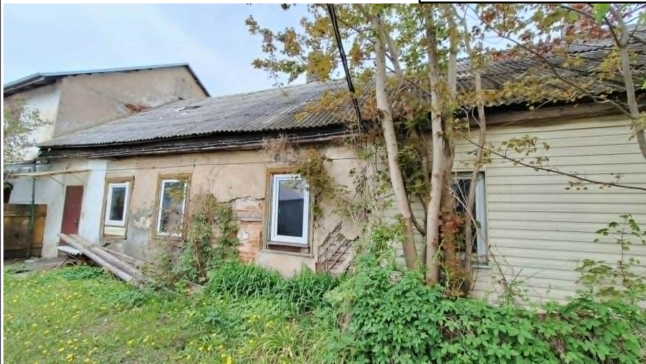
Nr. 1 Pavadinimas PV fasado fragmentas