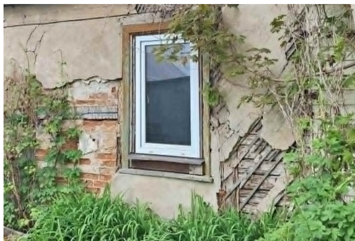
Nr. 3 Pavadinimas Fasadų apdailos fragmentai