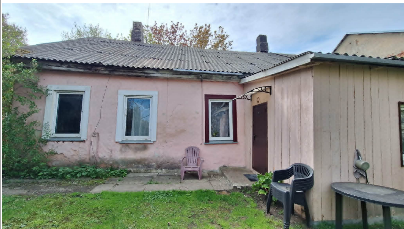
Nr. 2 Pavadinimas ŠR fasado fragmentas