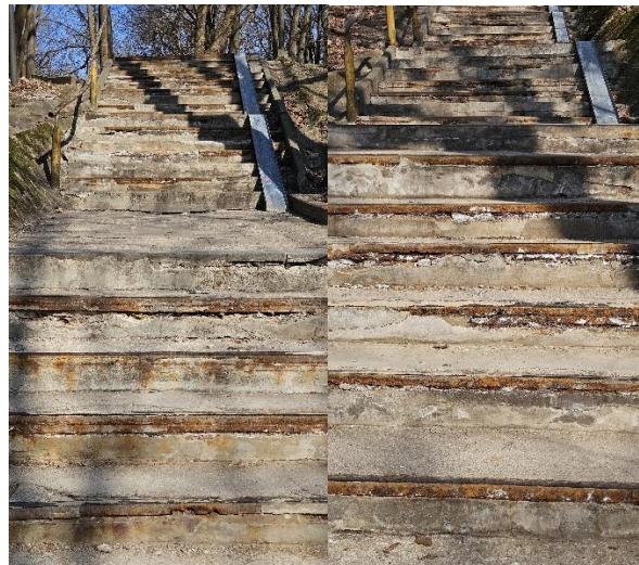
Laiptai jungiantys Vytauto parką su Laisvės alėja

Kita veikla. Tikiu, kad politiko darbas prasideda nuo pagarbos istorinei atminčiai, todėl aktyviai dalyvauju visose svarbiausiose tautos bendrystės akimirkose: nuo Sausio 13-osios ir Lietuvos valstybės atkūrimo minėjimų iki Romo Kalantos pasiaukojimo pagerbimo. Gedulo ir vilties dieną prisijungiau prie akcijos „Ištark, Išgirk, Išsaugok“, o per Visų Šventųjų dieną nusilenkiau tiems, kurie paaukojo gyvybes už mūsų laisvę – prie paminklo „Kovotojų už Lietuvos laisvę Motinai“, tremtinių kryžiaus Fryko g. bei partizanų vado A. Ramanausko-Vanago memorialo. Šios akimirkos primena, kad tarnystė Lietuvai yra ne tik pareiga, bet ir moralinis įsipareigojimas.