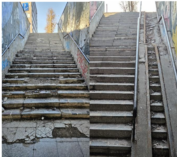
Požeminė perėja po Savanorių prospektu, šalia „Saulės“ gimnazijos

paminėsiu - kreipiausi į Kauno miesto savivaldybę dėl Lietuvos politinių kalinių ir tremtinių sąjungos atleidimo nuo nekilnojamojo turto bei žemės nuomos mokesčių, taip pat teikiau prašymą Savivaldybės kontrolės ir audito tarnybai dėl papildomos informacijos apie vietinę rinkliavą už leidimus atlikti kasinėjimo darbus viešojo naudojimo teritorijose. Be to, inicijavau skubius remonto darbus laiptuose, jungiančiuose Vytauto parką su Laisvės alėja, bei požeminėje perėjoje po Savanorių prospektu, šalia „Saulės“ gimnazijos, siekdamas užtikrinti pėsčiųjų saugumą ir sklandų susisiekimą.