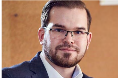
Robertas Kaunas / Komeninio archyvo nuotr.