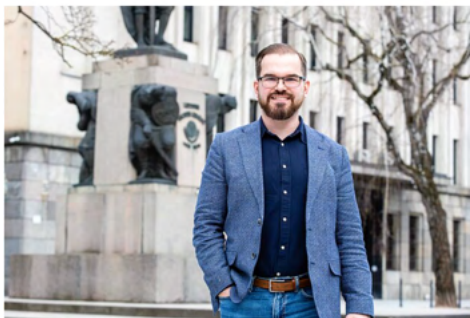
Robertas Kaunas / T. Bilušio/BNS nuotr.