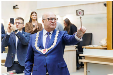
ASOCIATYVAI - KAUNO DAIRYBOS NAUJIŲ IR MERO PREGAUKA

KAUNAS KADYRSTALIS RP 20240403 14:29 DALINTIS FACEBOOK