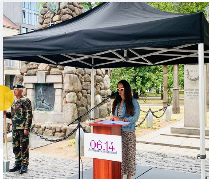
Akcija „Ištark, išgirsk, išsaugok“