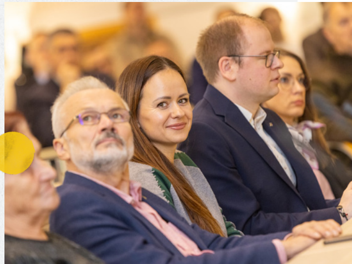
Diskusijoje „Kaip gintume Kauną?“