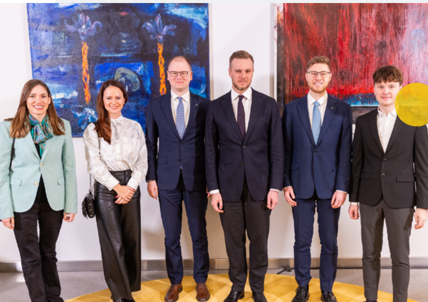
Diskusijoje „O kas jei...“