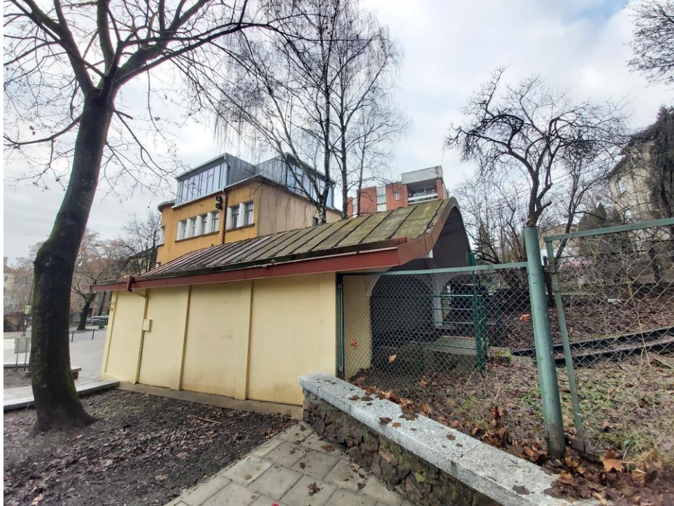
Nr. 9 Pavadinimas Žaliakalnio funikulieriaus statinių komplekso paviljonas