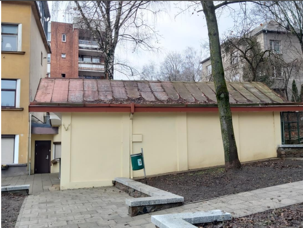
Nr. 8 Pavadinimas Žaliakalnio funikulieriaus statinių komplekso paviljonas