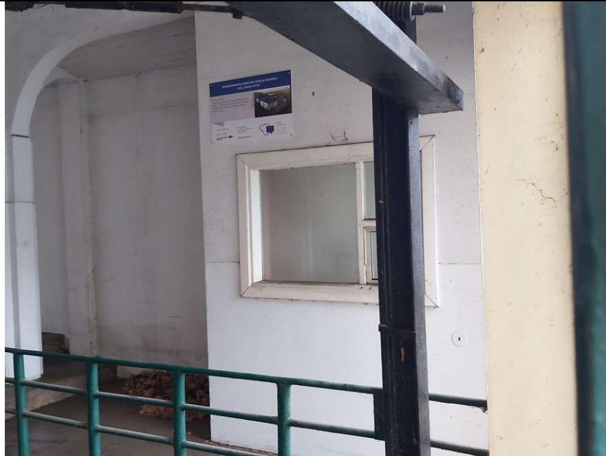
Nr. 7 Pavadinimas Žaliakalnio funikulieriaus statinių komplekso paviljonas