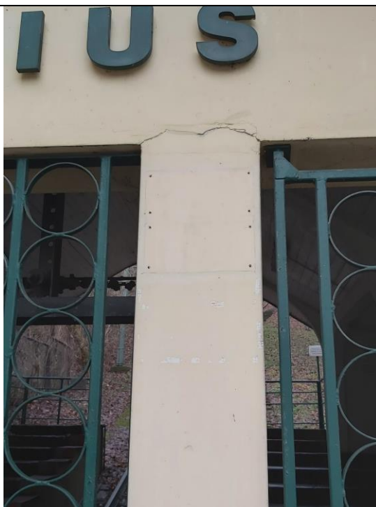
Nr. 3 Pavadinimas Žaliakalnio funikulieriaus statinių komplekso paviljonas