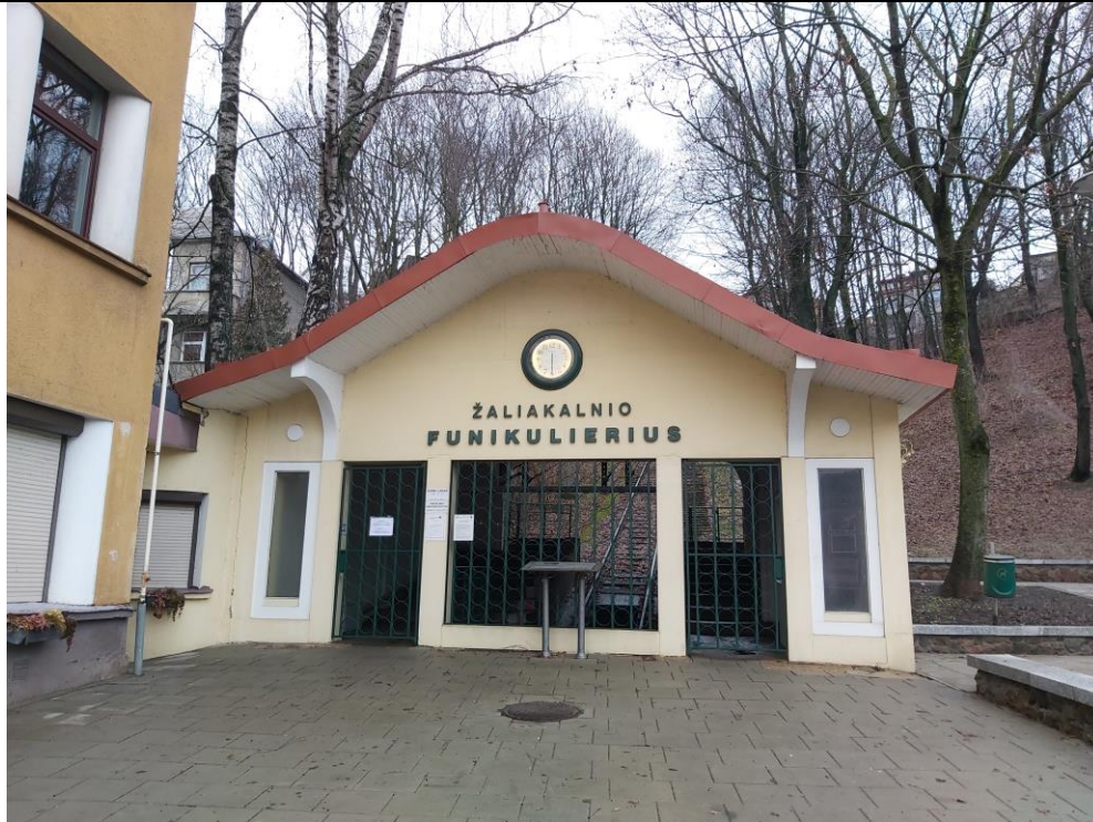
Nr. 1 Pavadinimas Žaliakalnio funikulieriaus statinių komplekso paviljonas