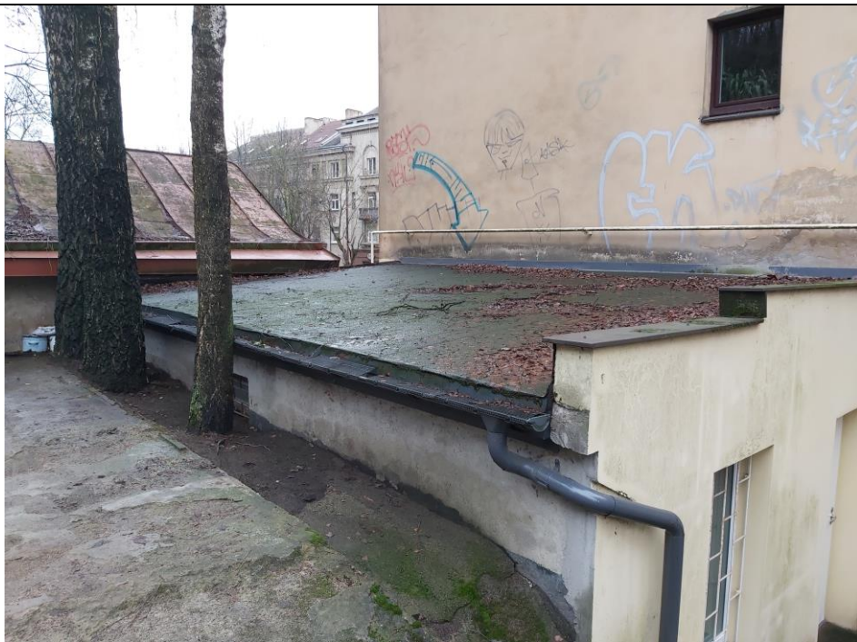
Nr. 12 Pavadinimas Žaliakalnio funikulieriaus statinių komplekso paviljonas