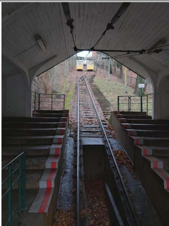
Nr. 13 Pavadinimas Žaliakalnio funikulieriaus statinių komplekso paviljonas