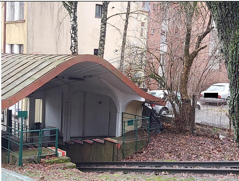
Nr. 10 Pavadinimas Žaliakalnio funikulieriaus statinių komplekso paviljonas