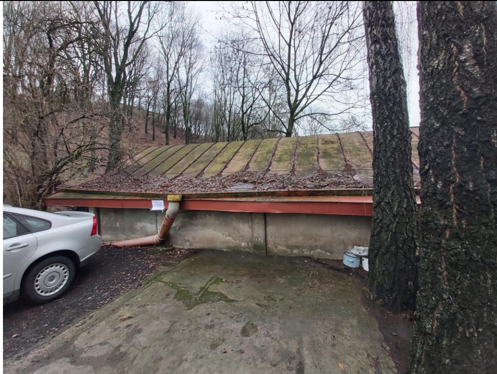
Nr. 11 Pavadinimas Žaliakalnio funikulieriaus statinių komplekso paviljonas