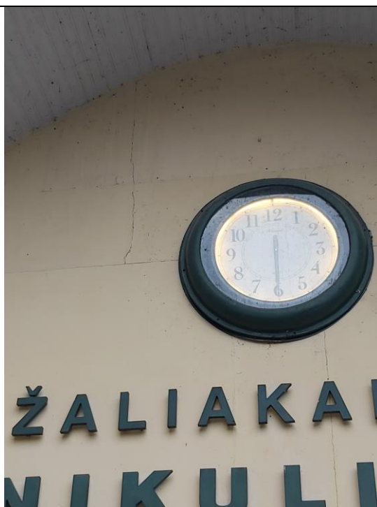
Nr. 4 Pavadinimas Žaliakalnio funikulieriaus statinių komplekso paviljonas