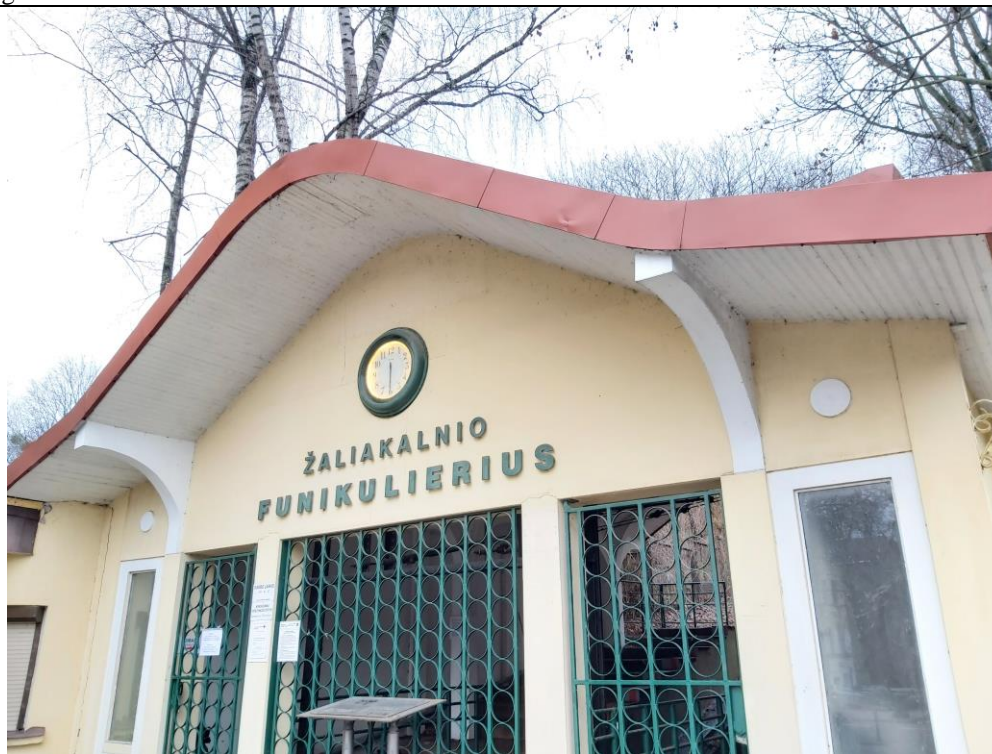
Nr. 2 Pavadinimas Žaliakalnio funikulieriaus statinių komplekso paviljonas