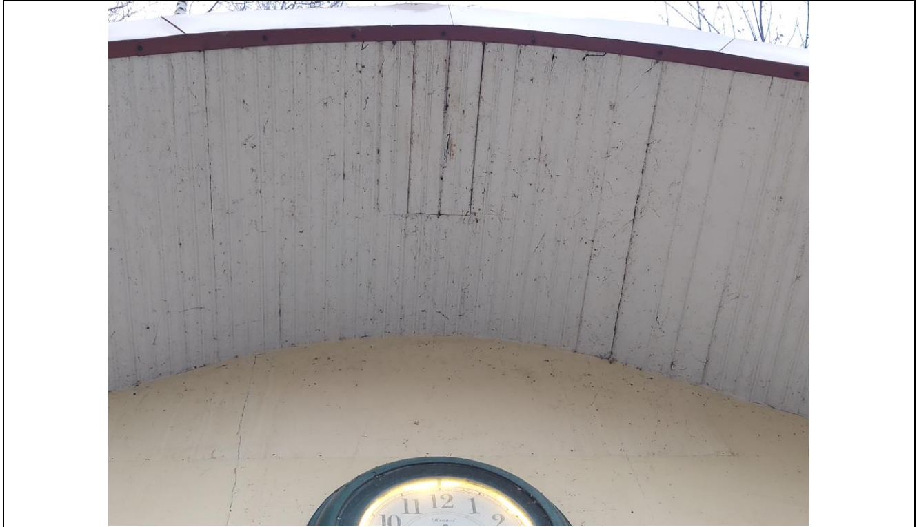
Nr. 5 Pavadinimas Žaliakalnio funikulieriaus statinių komplekso paviljonas Fotografavo Dovilė Miliukštė