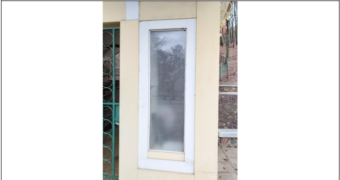
Nr. 6 Pavadinimas Žaliakalnio funikulieriaus statinių komplekso paviljonas