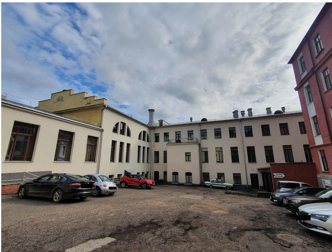
FF-2. Šfasado kiemelis.