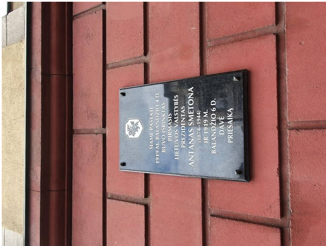
FF-8. V fasado fragmentas