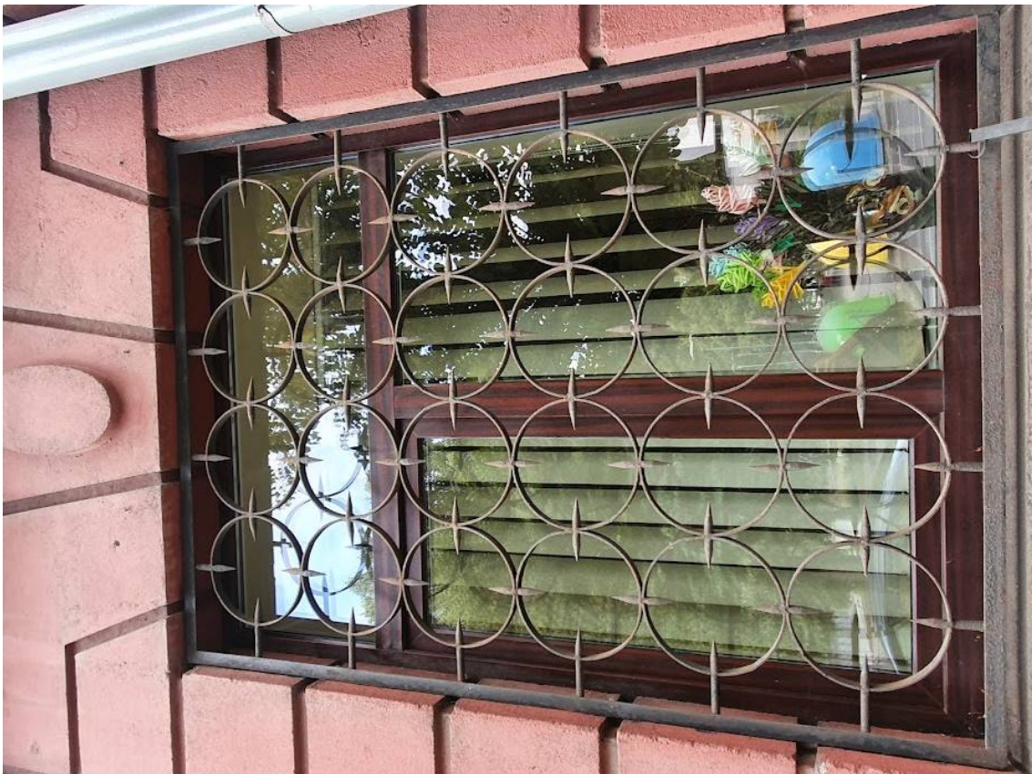
FF-10. P fasado lango fragmentas