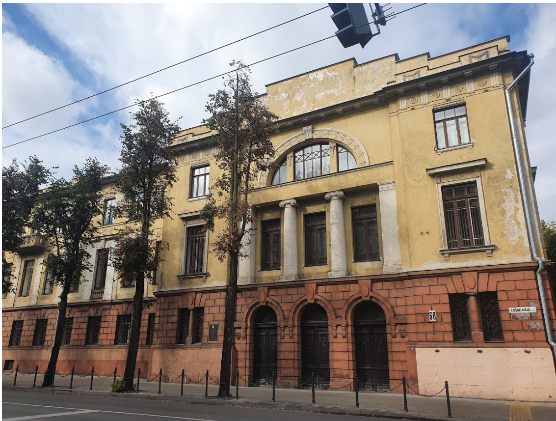
FF-6. P fasado fragmentas, venecijietiškas langas, jonėninio orderio kolonos, laiptuotas frontonas, rustuotas cokolis.