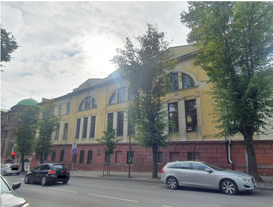
FF-4. V fasadas, venecijietiški langai, piliastrai, rustuotas cokolis, frontonai.