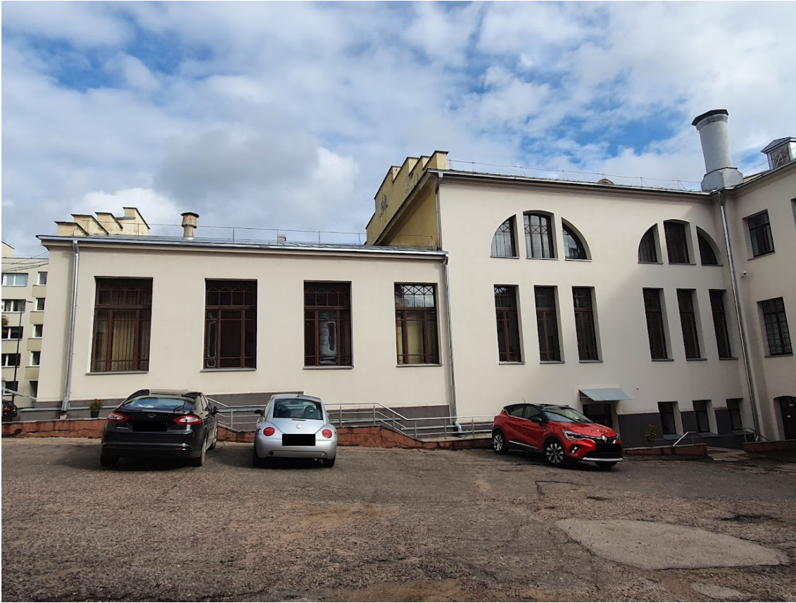
FF-3. Š fasado kiemelio fasado fragmentas.