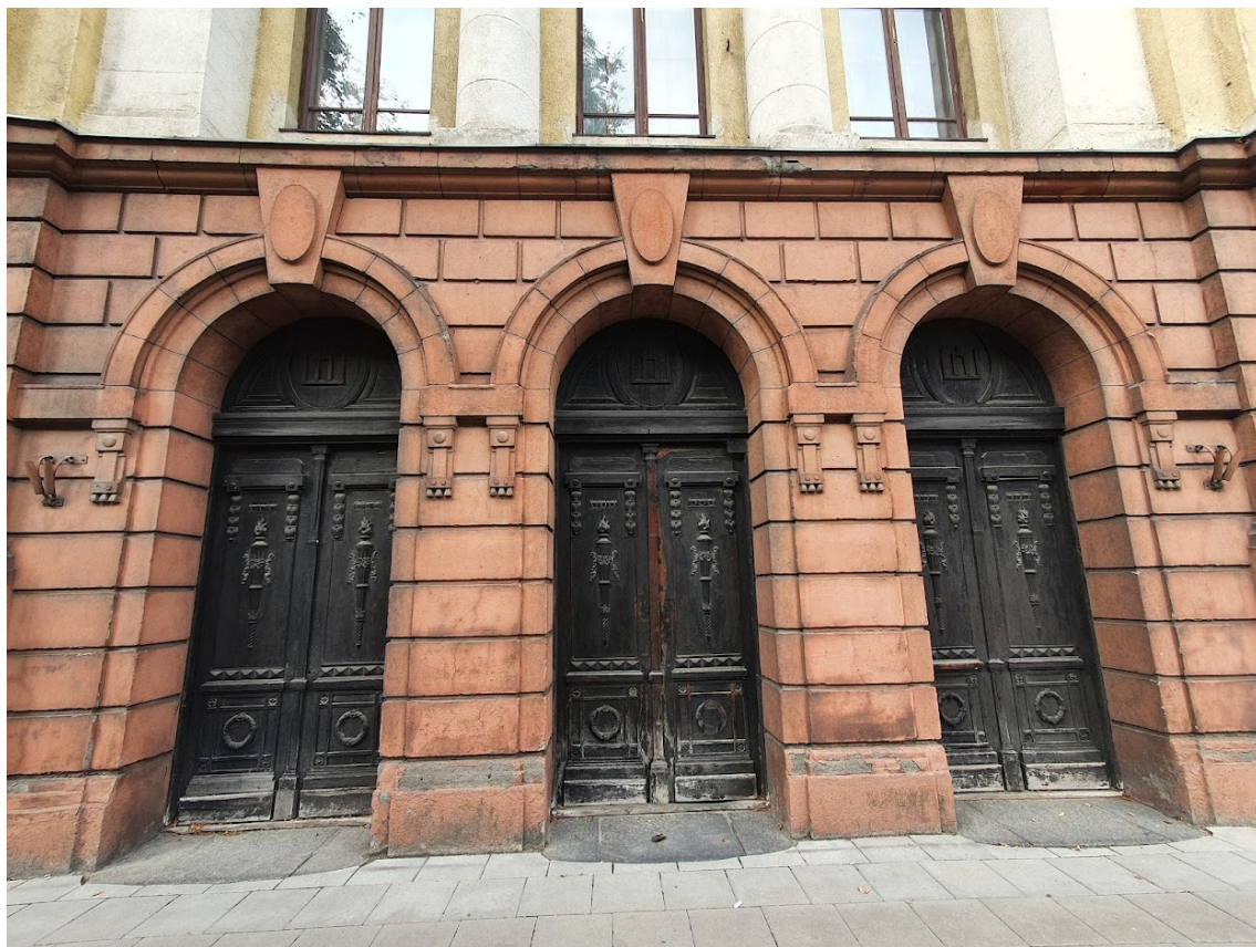
FF-7. P fasado fragmentas, rustais puoštos išilgintos pusapskritės arkos durys