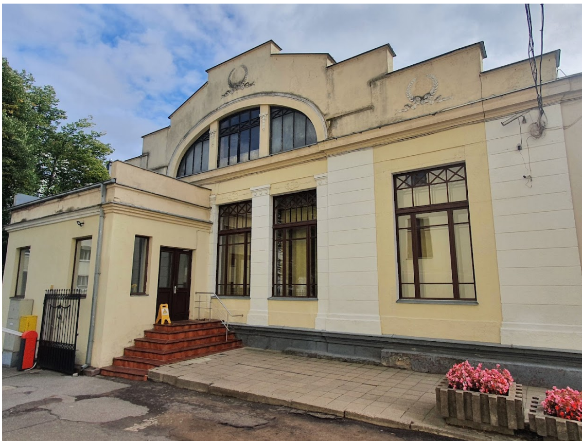
FF-1. Pagr. Šfasadas rustuotais piliastrais, mentēmis, frontonu