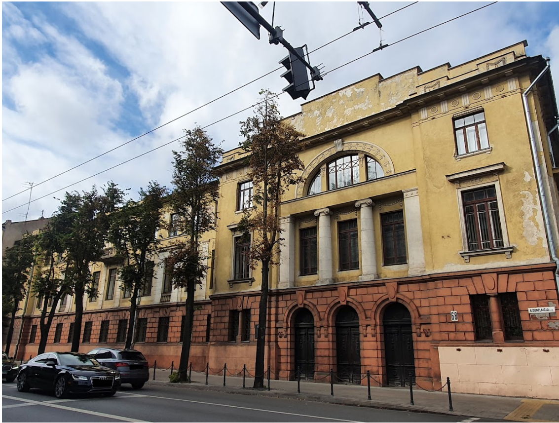
FF-5. P fasadas