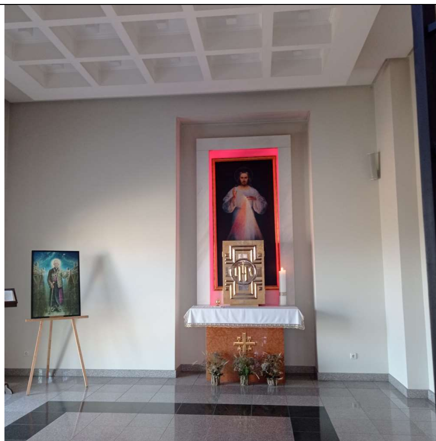
Nr. 4 Pavadinimas Altorius su tabernakuliu