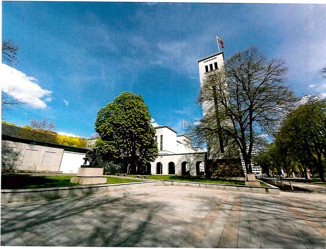
FF-3. Kariliono ir laikrodžio bokštas. V fasadas.