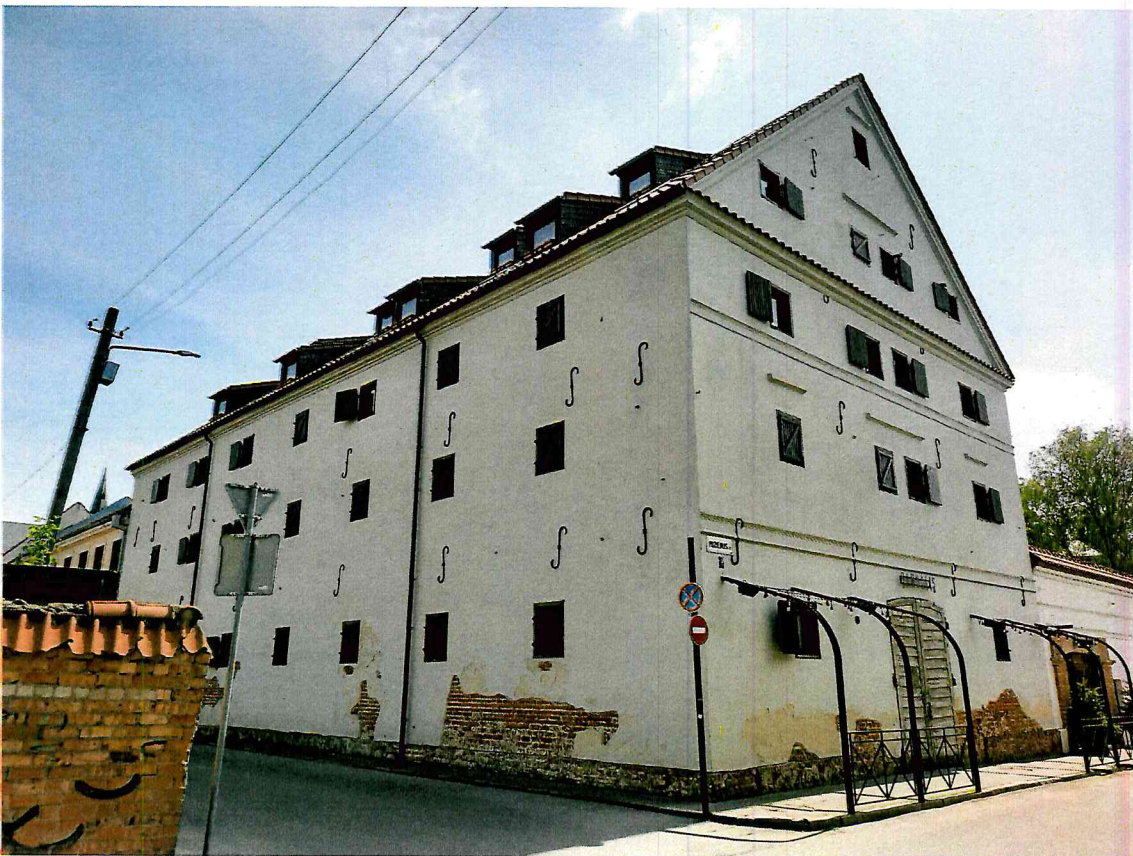
FF-4. Sandēliju komplekso antrasis sandēlis (25981).