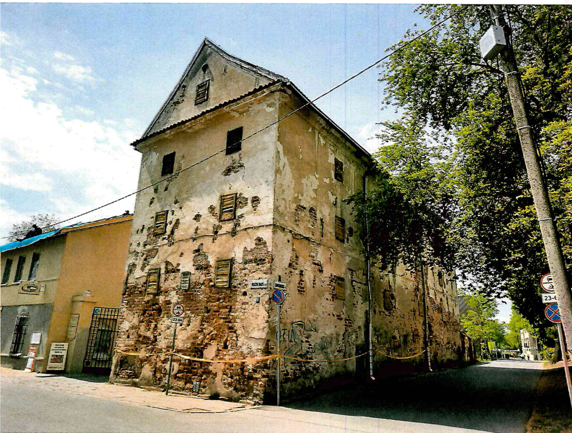
FF-2. Sandēliju komplekso pirmais sandēlis (25980).