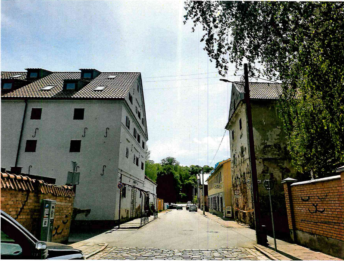
FF-1. Sandēliju komplekso pirmais ir antrasis sandēlii. P fasadu fragmentas.