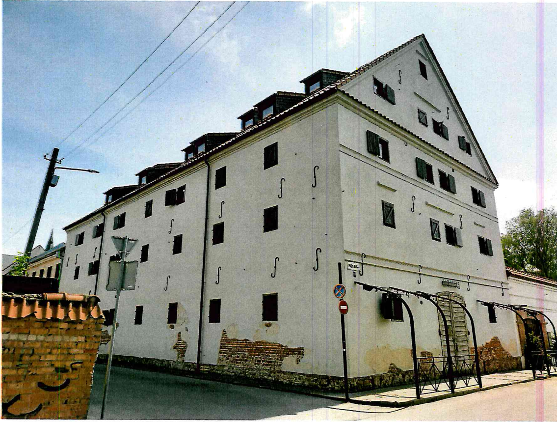
FF-1. Š ir V fasadai su dekoru ir kt. elementais.