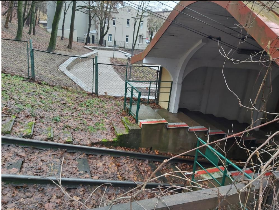
Nr. 5 Pavadinimas Žaliakalnio funikulieriaus statinių komplekso kelias su įranga