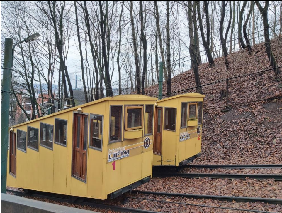
Nr. 3 Pavadinimas Žaliakalnio funikulieriaus statinių komplekso kelias su įranga Fotografavo Dovilė Miliukštė