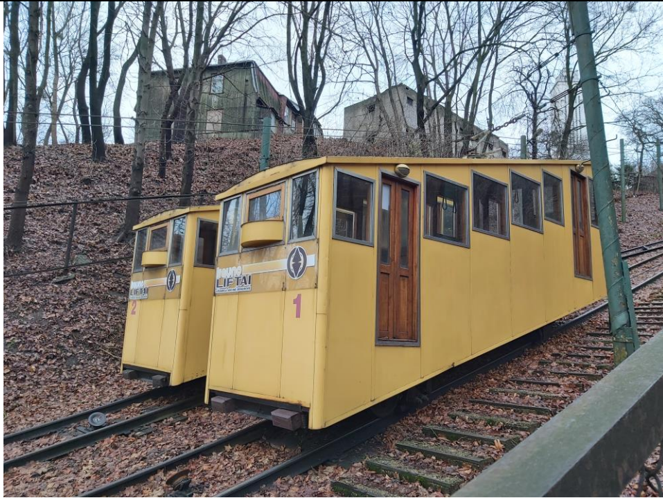
Nr. 1 Pavadinimas Žaliakalnio funikulieriaus statinių komplekso kelias su įranga