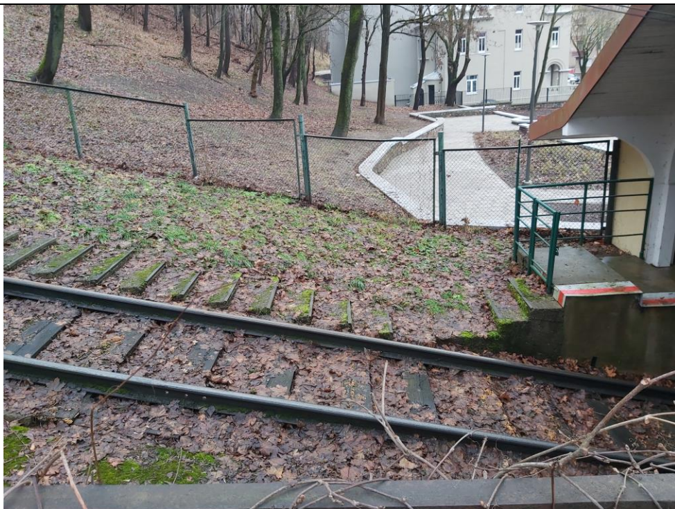
Nr. 8 Pavadinimas Žaliakalnio funikulieriaus statinių komplekso kelias su įranga