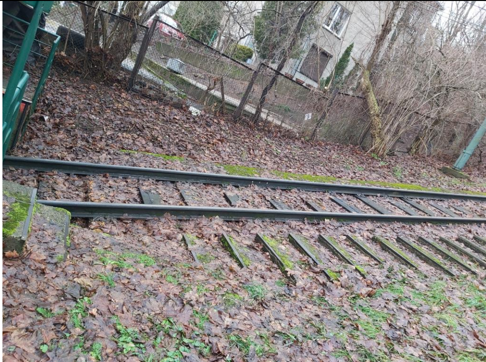
Nr. 7 Pavadinimas Žaliakalnio funikulieriaus statinių komplekso kelias su įranga