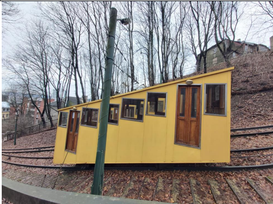
Nr. 2 Pavadinimas Žaliakalnio funikulieriaus statinių komplekso kelias su įranga