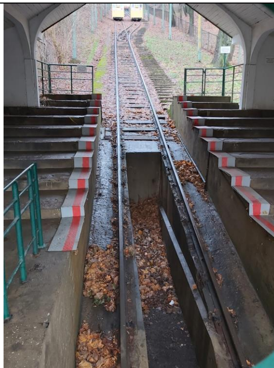
Nr. 6 Pavadinimas Žaliakalnio funikulieriaus statinių komplekso kelias su įranga