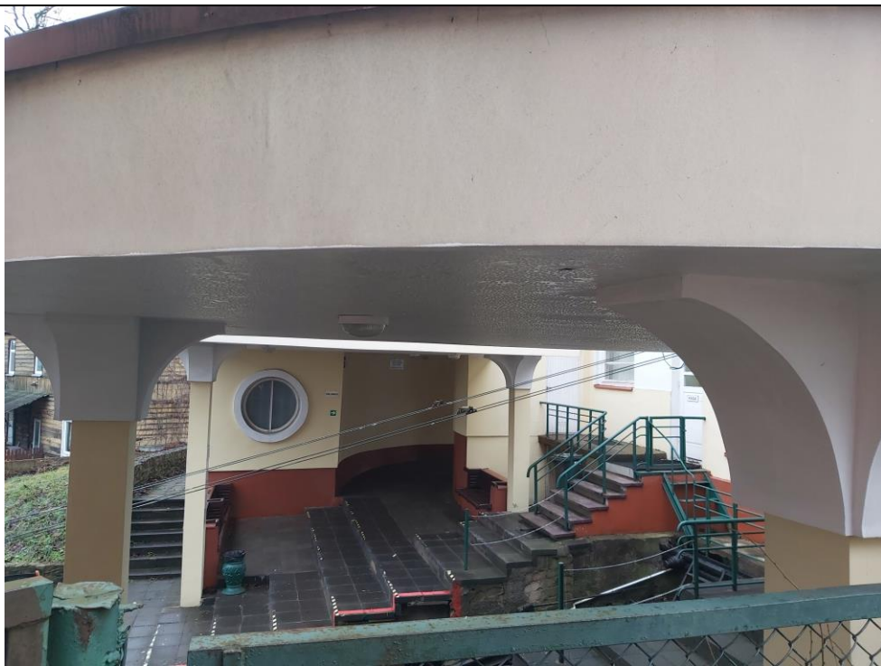
Nr. 10 Pavadinimas Žaliakalnio funikulieriaus statinių komplekso kelias su įranga