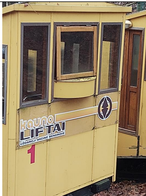
Nr. 4 Pavadinimas Žaliakalnio funikulieriaus statinių komplekso kelias su įranga