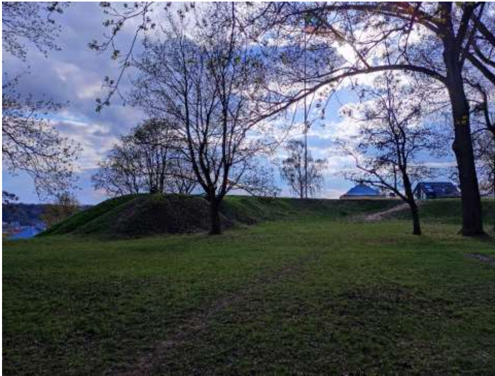
Nr. 1 Pavadinimas Kauno tvirtovės 9-osios baterijos liekanų komplekso baterijos liekanos Data 2021-04-29