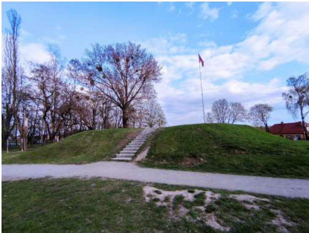
Nr. 3 Pavadinimas Kauno tvirtovės 9-osios baterijos liekanų komplekso baterijos liekanos Data 2021-04-29