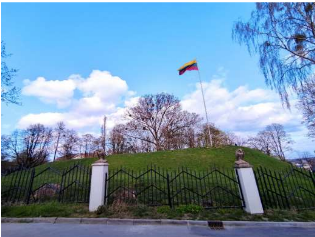
Nr. 4 Pavadinimas Kauno tvirtovės 9-osios baterijos liekanų komplekso baterijos liekanos Data 2021-04-29