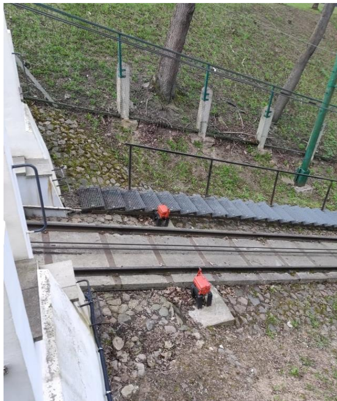
Nr. 2 Pavadinimas Aleksoto funikulieriaus statinių komplekso kelias su įranga Data 2021-04-28