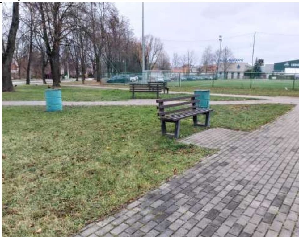
Nr. 6 Pavadinimas Kauno Petro Vileišio aikštė