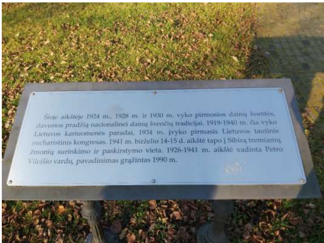
Nr. 4 Pavadinimas Kauno Petro Vileišio aikštė