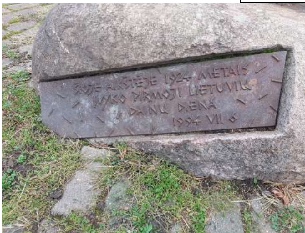
Nr. 5 Pavadinimas Kauno Petro Vileišio aikštė