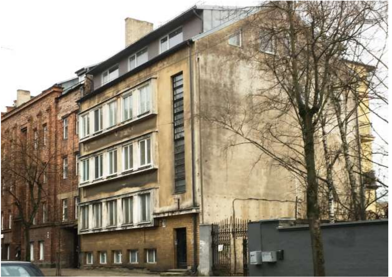
Pastato V fasadai (F-1)