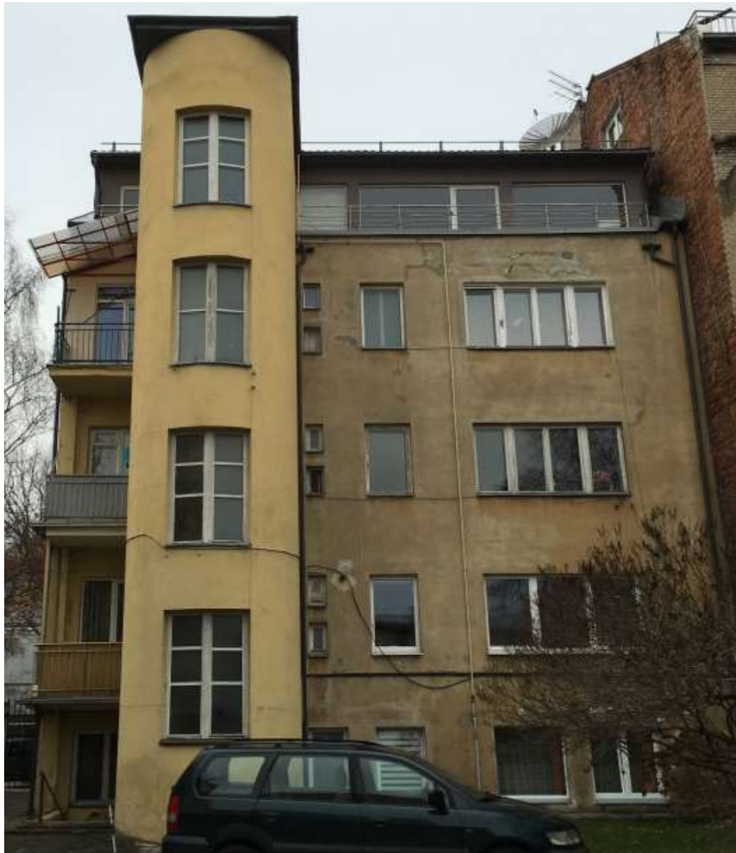
Pastato PR fasadas (F-3)