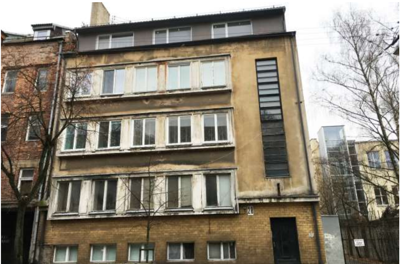
Pastato ŠV fasadas (F-2)