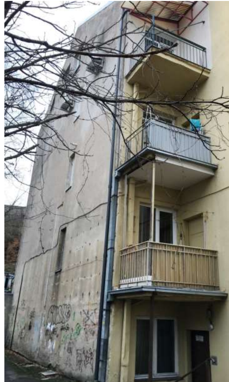
Pastato P fasadas (F-4)