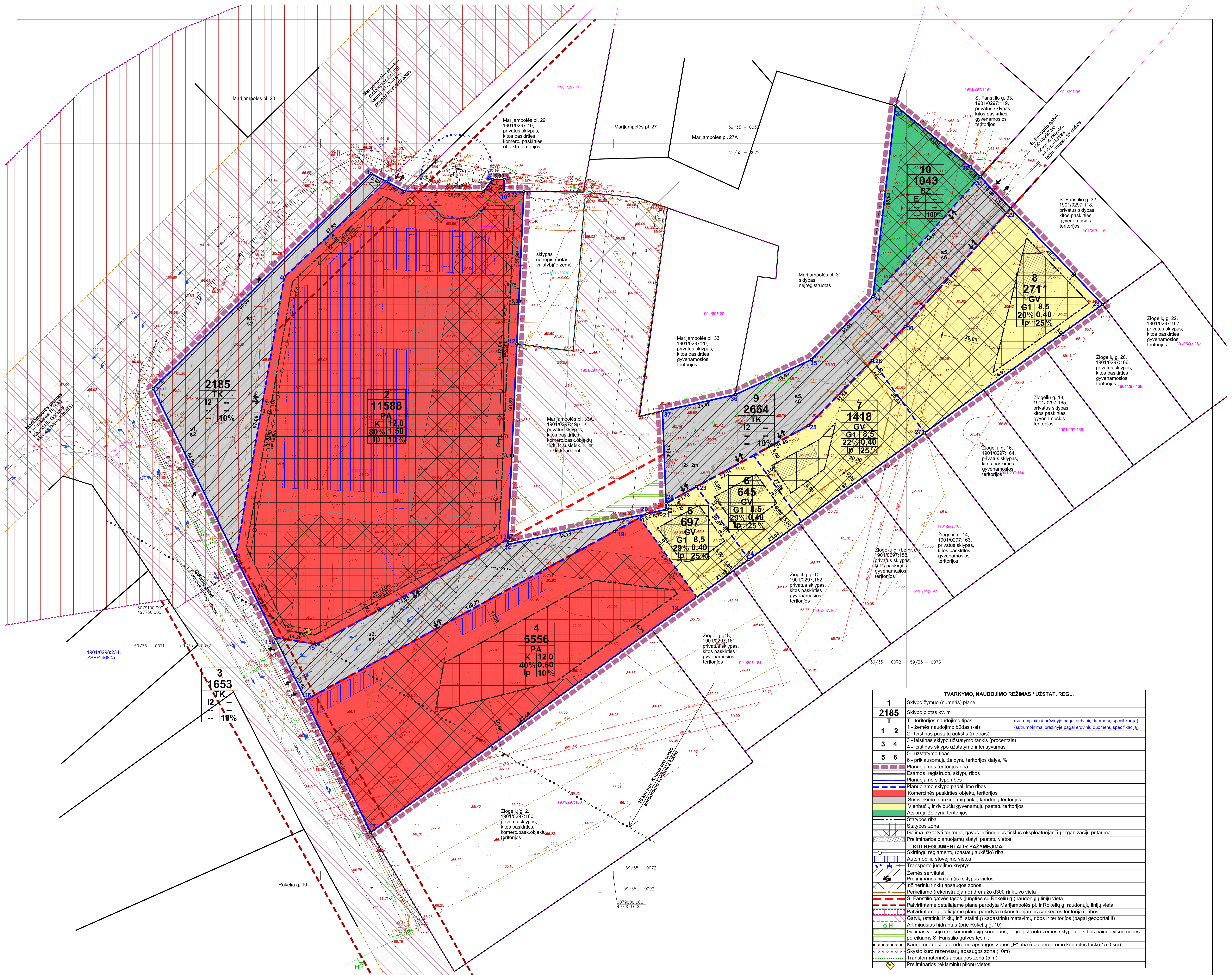
TERITORIJOS NAUDOJIMO REGLAMENTŲ APRAŠOMOJI LENTELĖ