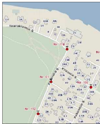
GAISRINIŲ HIDRANTŲ IŠDĖSTYMO SCHEMA