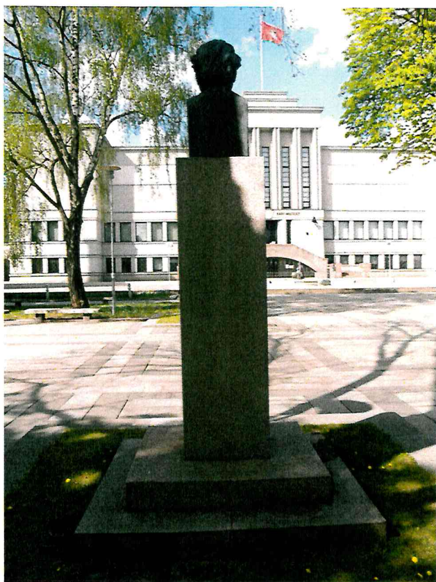
3 pav. Paminklo vaizdas iš galinės pusės