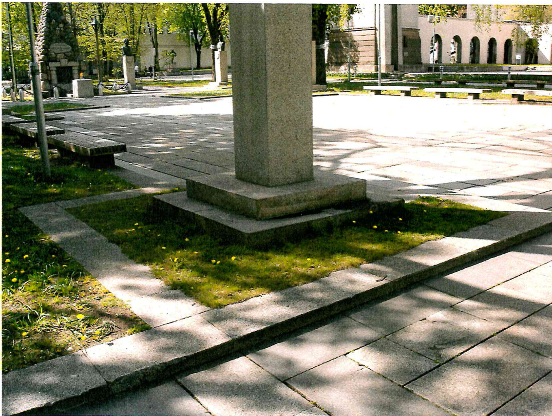
8 pav. Paminklo aplinka yra tvarkinga ir prižiūrima