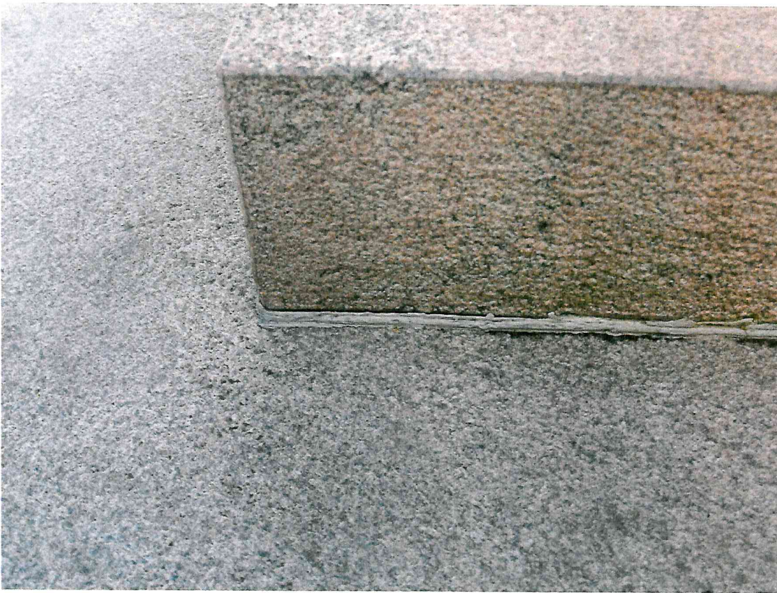
5 pav. Esama hermetizuojanti medžiaga siūlėse atkibusi nuo granito elementų