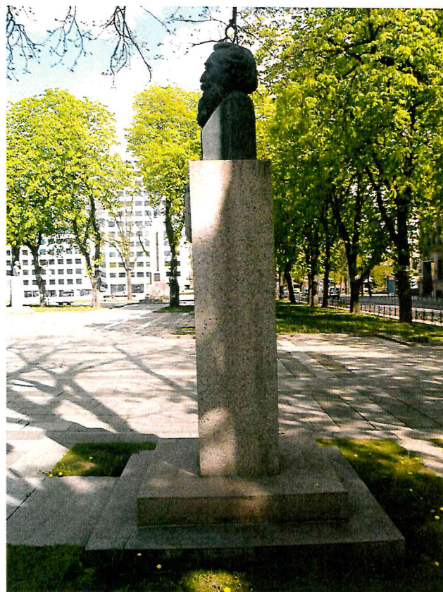
2 pav. Paminklo vaizdas iš dešinės pusės