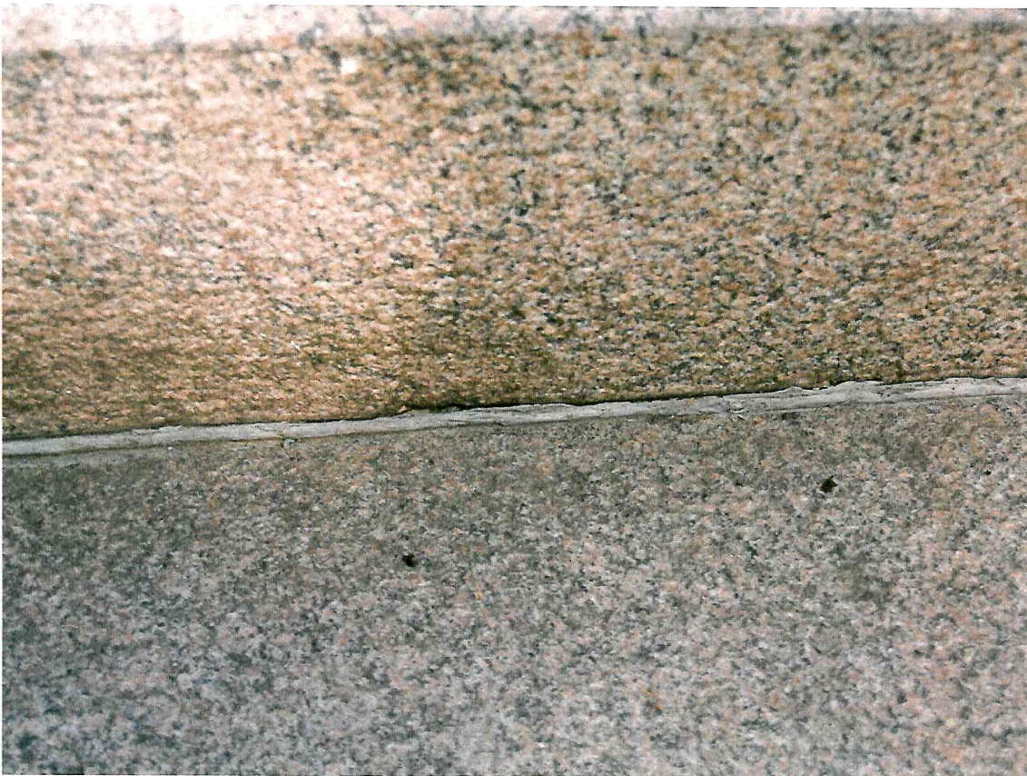
6 pav. Pro siūlę hermetizuojančią medžiagą krituliai patenka į konstrukcijos vidų