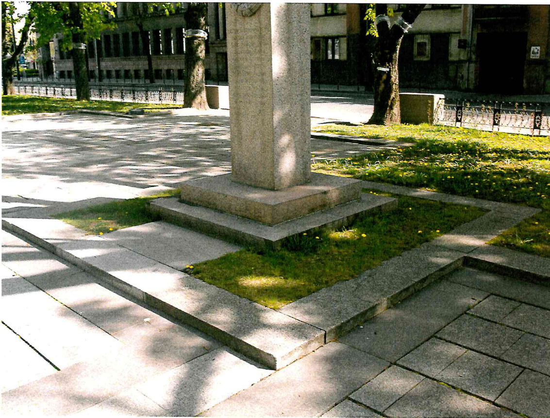
7 pav. Paminklo aplinka yra tvarkinga ir prižiūrima