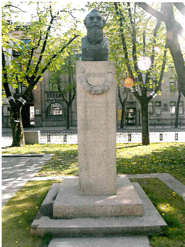
1 pav. Paminklo vaizdas iš priekio