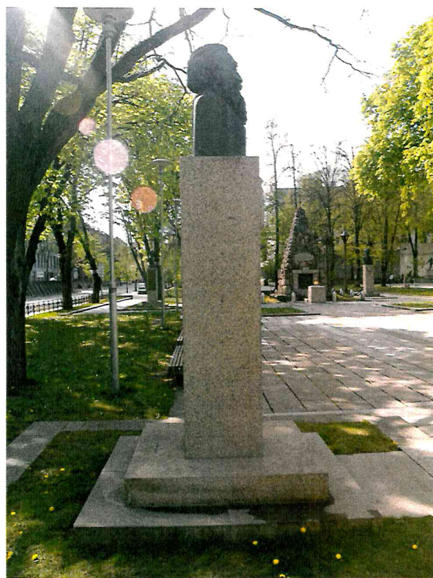
4 pav. Paminklo vaizdas iš kairės pusės