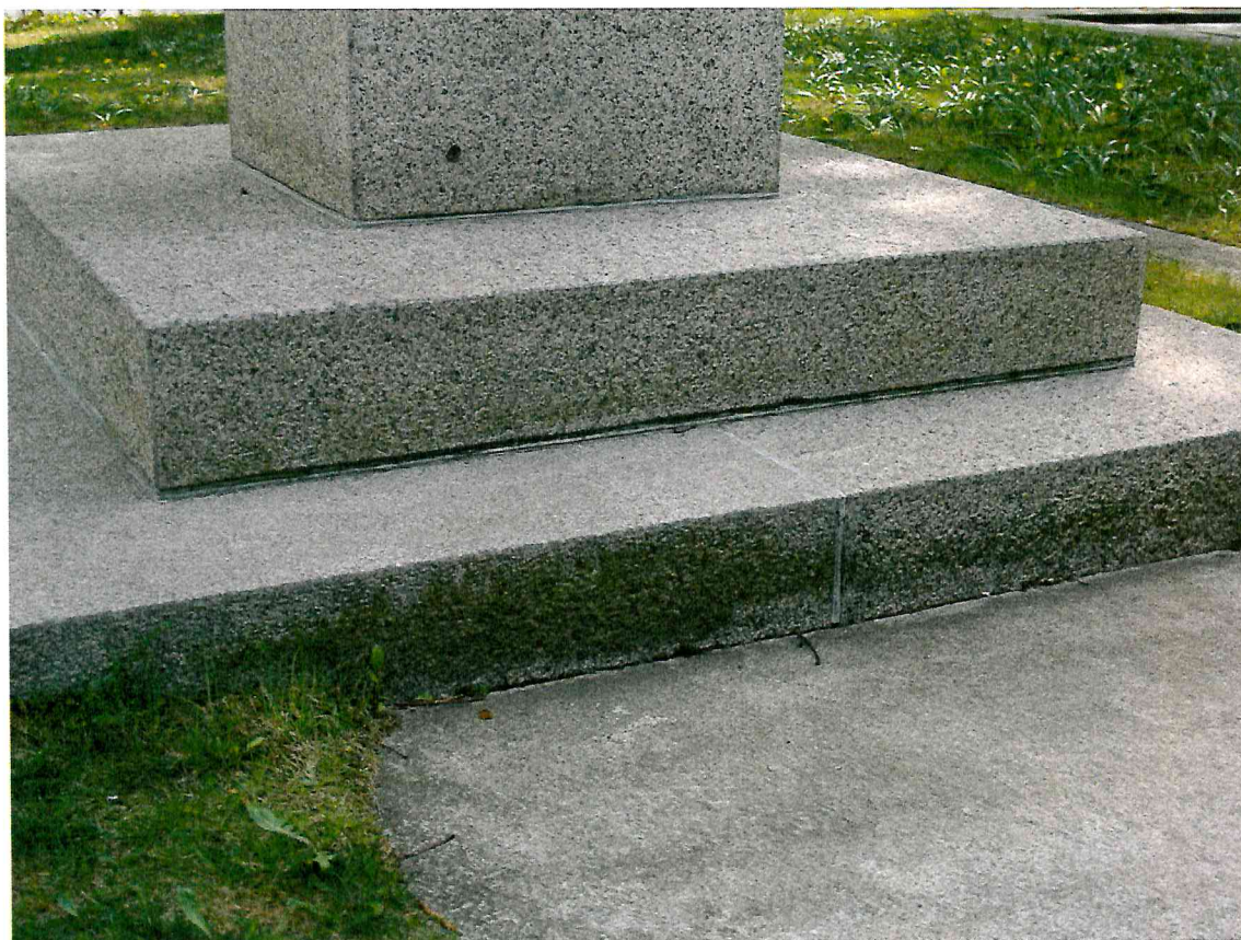
5 pav. Susidariusios žalsvos apnašos ant granitinio cokolio