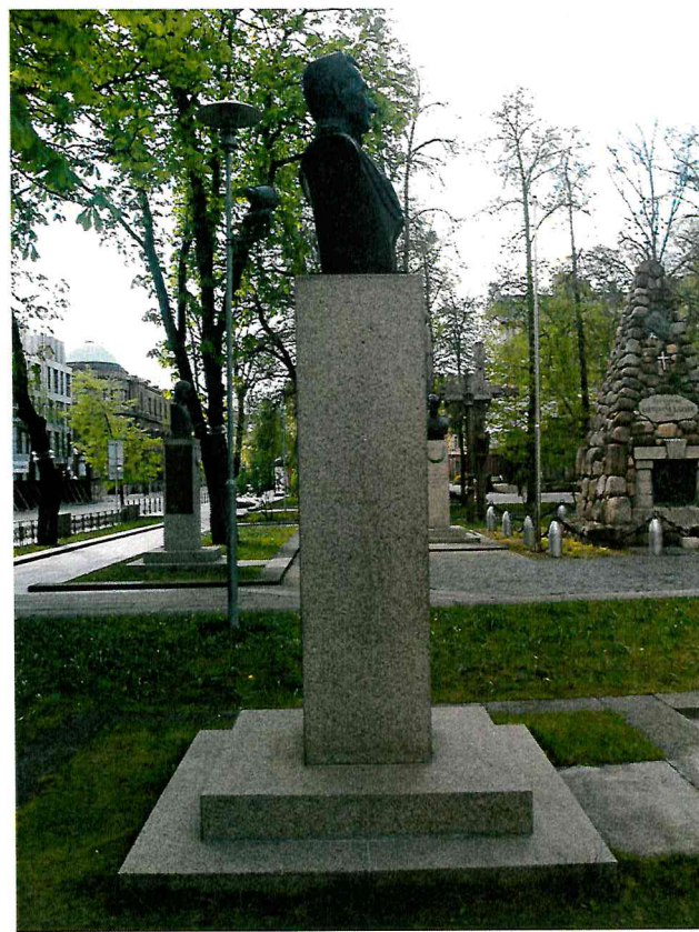
4 pav. Paminklo vaizdas iš kairės pusės