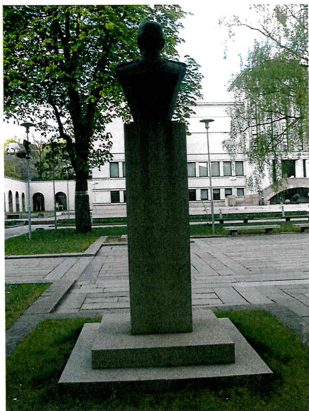
3 pav. Paminklo vaizdas iš galinės pusės. Matoma tamsi dėmė ant postamento