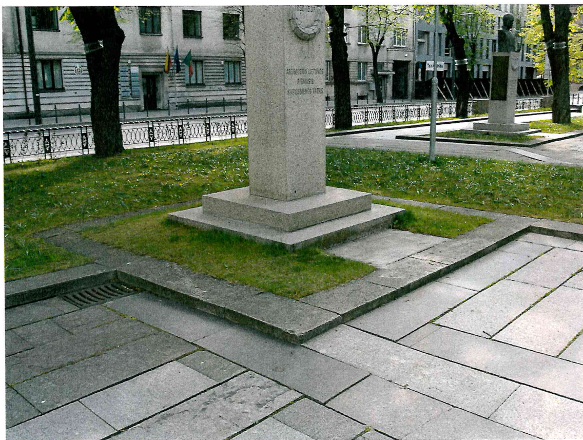
6 pav. Kūrinio aplinka yra tvarkinga ir prižiūrima