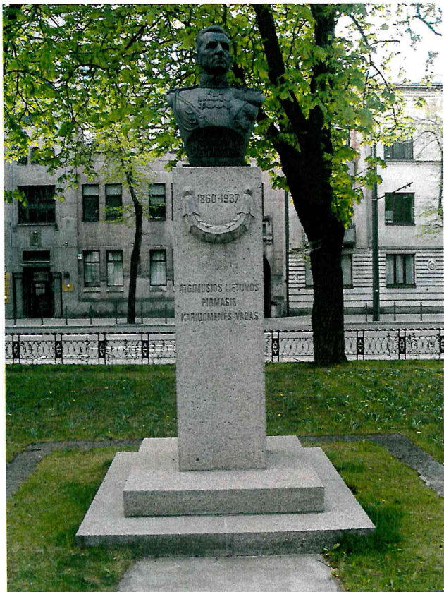
1 pav. Paminklo vaizdas iš priekio