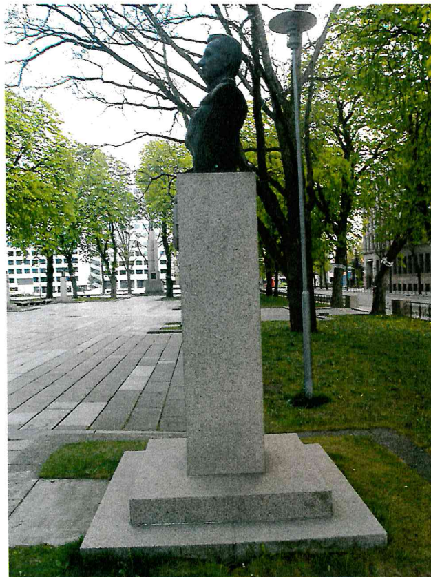
2 pav. Paminklo vaizdas iš dešinės pusės