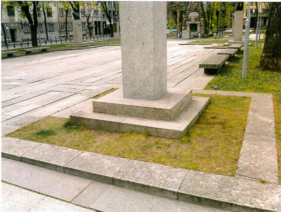
10 pav. Paminklo zonoje rekomenduojama iš naujo pasėti veją