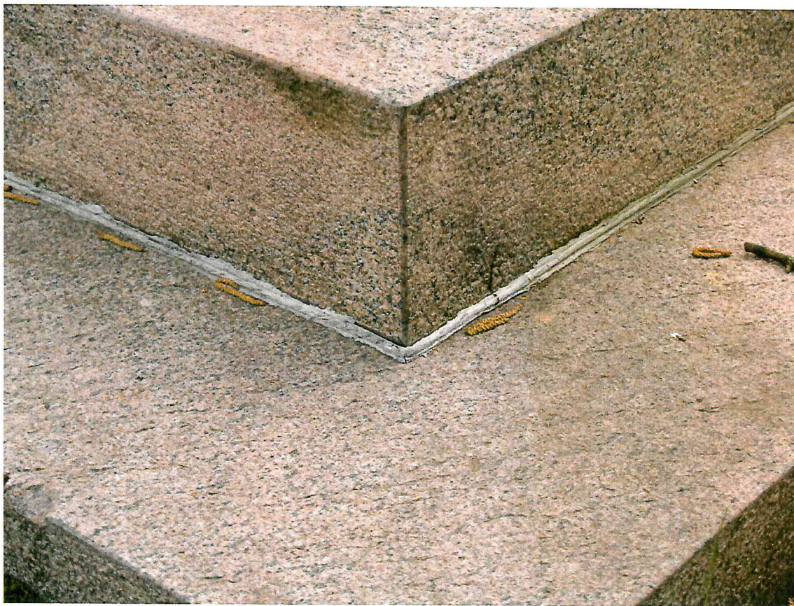
5 pav. Ties cokolio kampu esama siūlė sutrūkusi ir stumiama lauk iš po elementų