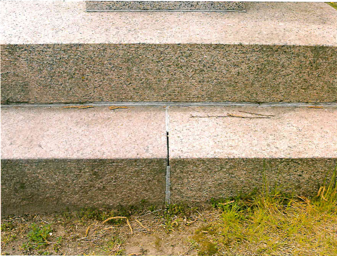
7 pav. Atviras siūlės fragmentas ties cokolio pirmu laiptu