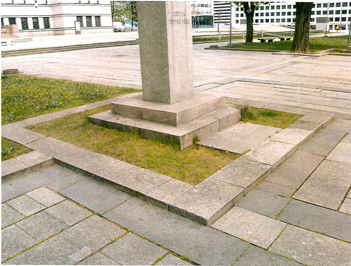
9 pav. Kūrinio aplinka yra tvarkinga ir prižiūrima