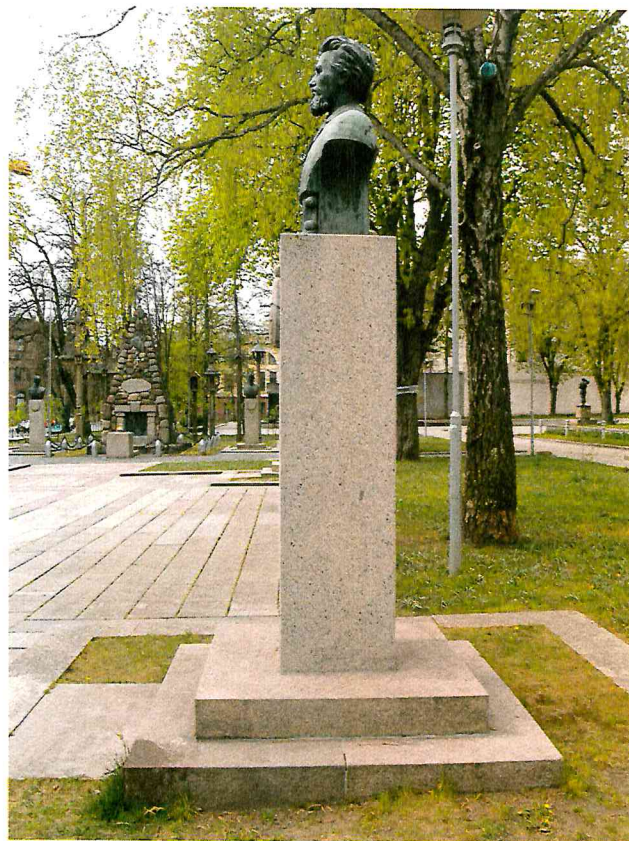
2 pav. Paminklo vaizdas iš dešinės pusės