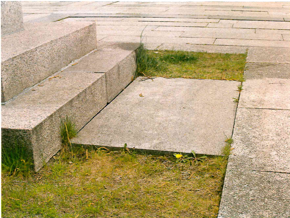
8 pav. Ties paminklo priekiu reiktų sukelti augalinį žemės sluoksnį, užsėjant veją