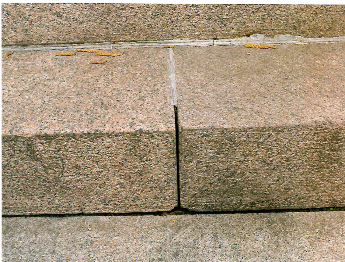
6 pav. Neužtaisytas siūlės fragmentas ties cokolio pirmu laiptu