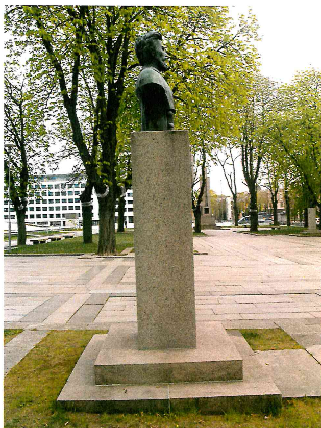
4 pav. Paminklo vaizdas iš kairės pusės