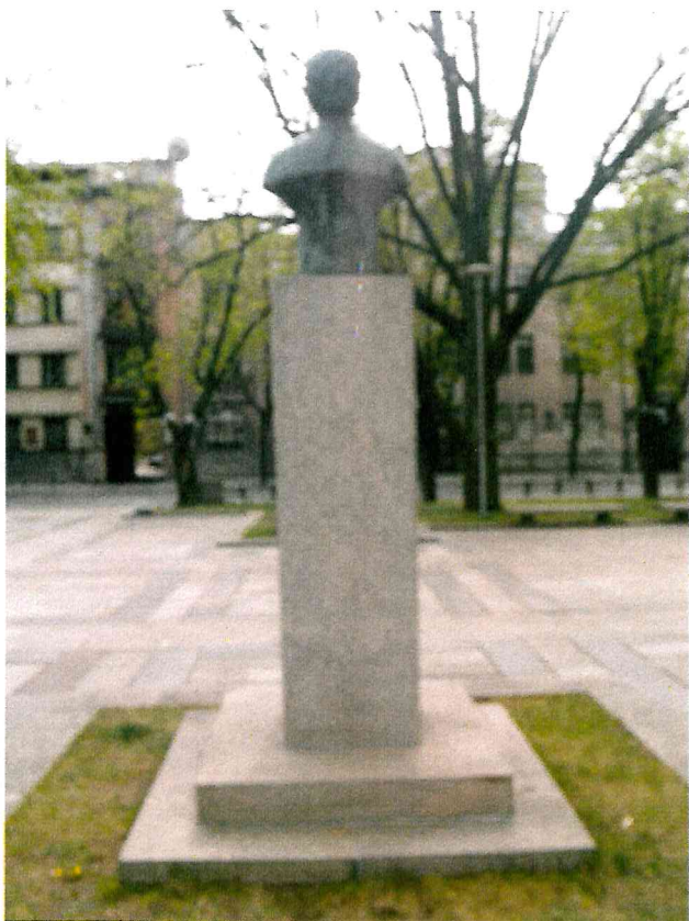
3 pav. Paminklo vaizdas iš galinės pusės