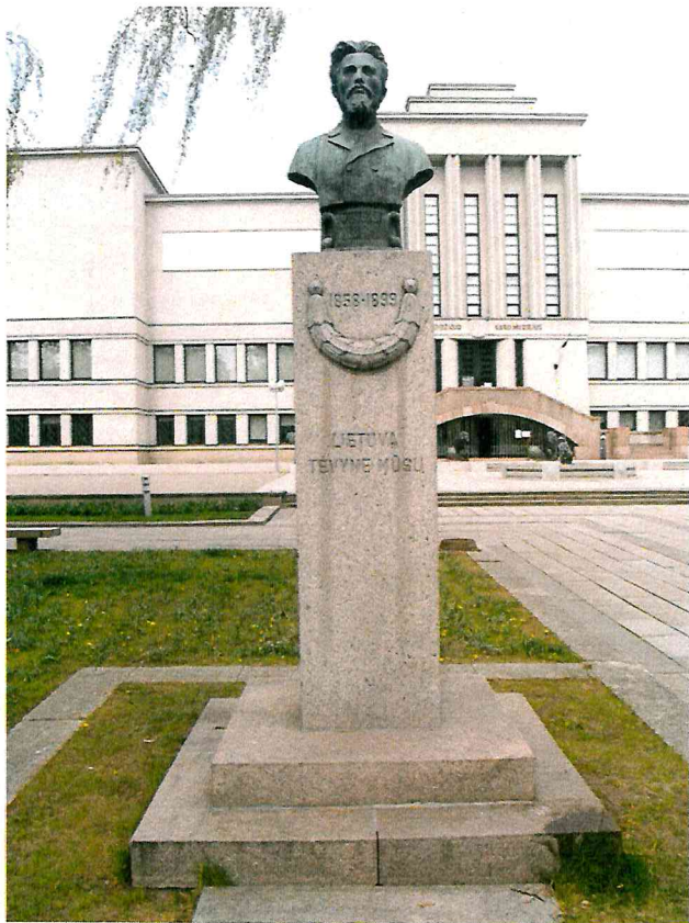
1 pav. Paminklo vaizdas iš priekio