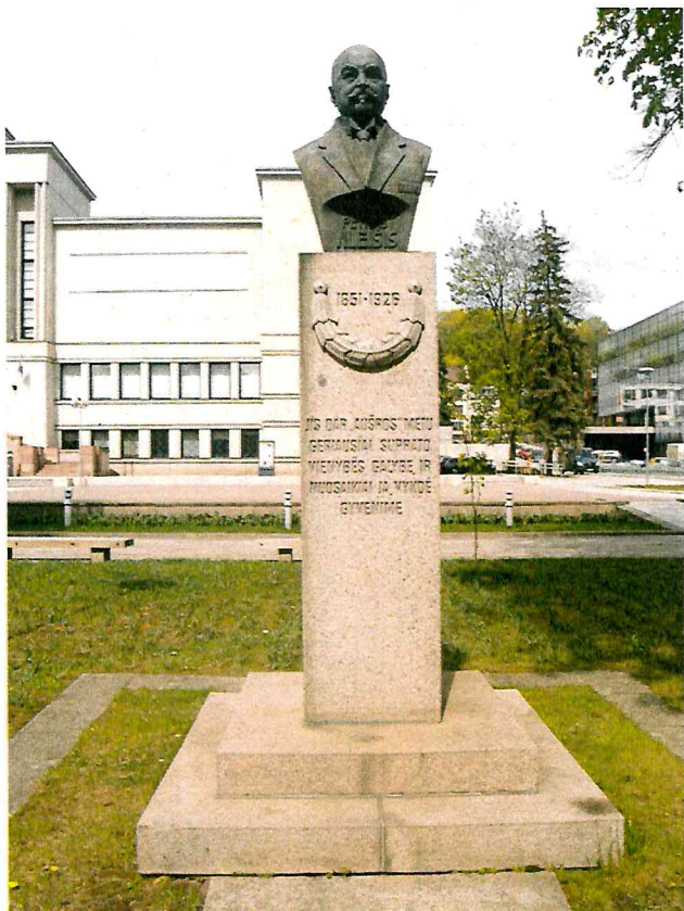
1 pav. Paminklo vaizdas iš priekio. Ant cokolio Matoma tamsi dėmė