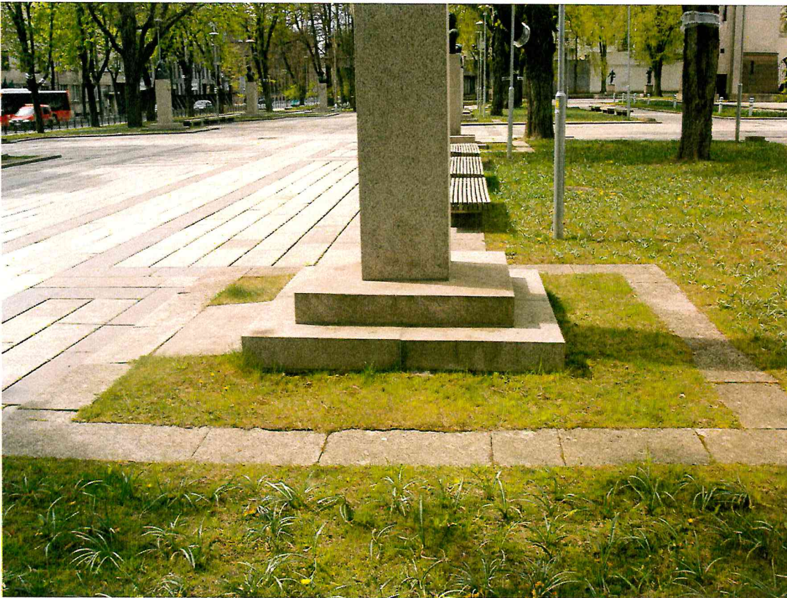
9 pav. Kūrinio aplinka yra tvarkinga, tačiau reiktų iš naujo suformuoti augalinį žemės sluoksnį