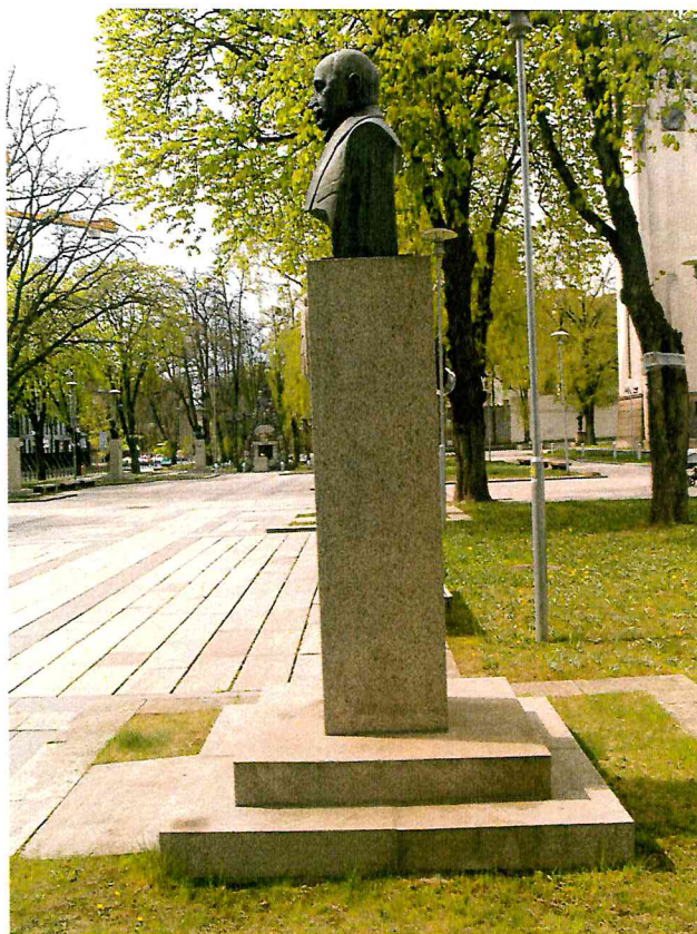
2 pav. Paminklo vaizdas iš dešinės pusės