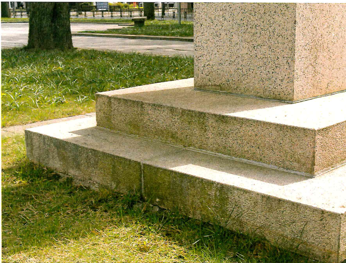
5 pav. Cokolis daugelyje vietų pasidengęs žalsvomis apnašomis