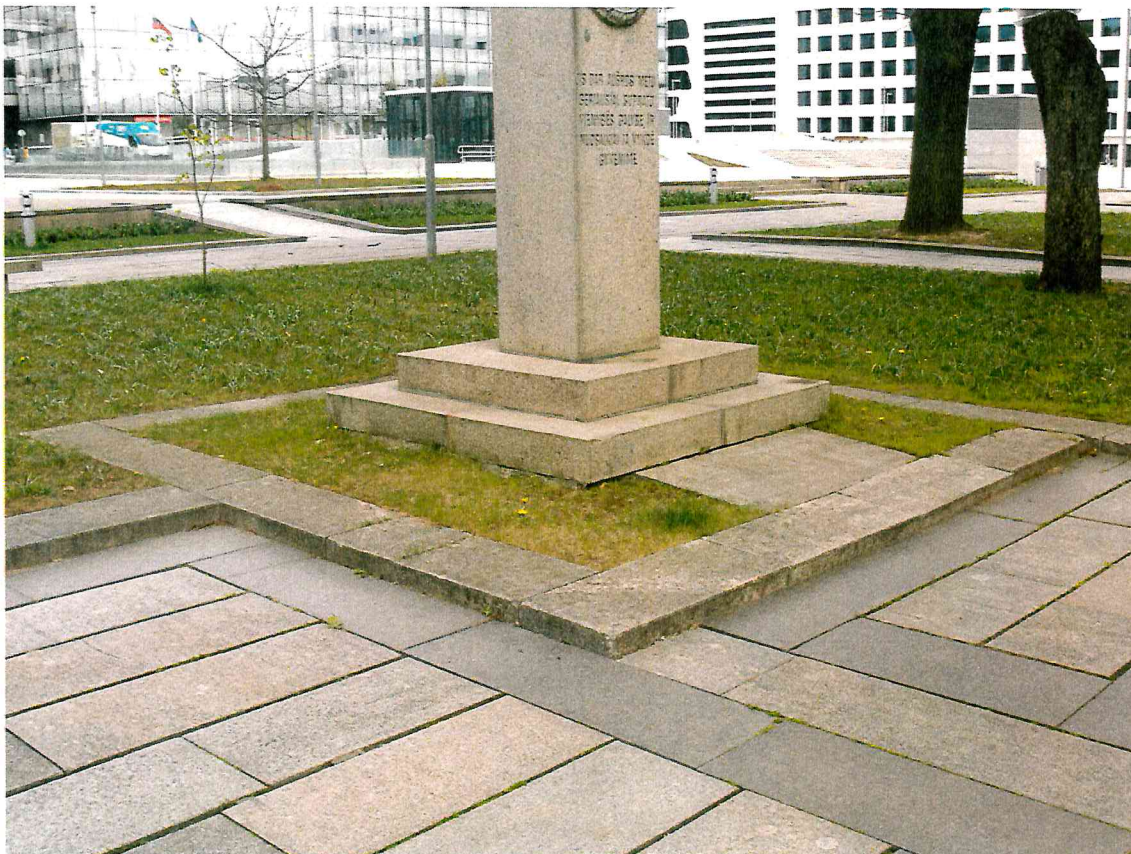
10 pav. Kūrinio aplinka yra tvarkinga, tačiau reiktų iš naujo suformuoti augalinį žemės sluoksnį