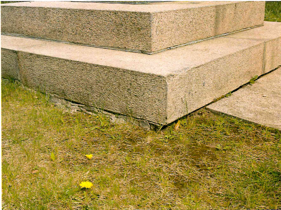
8 pav. Susidaręs tarpas, vietomis, grubiai užtaisytas betonu, kuris yra matomas ir vaizdo nepuošia