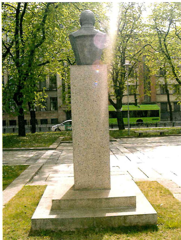
3 pav. Paminklo vaizdas iš galinės pusės.