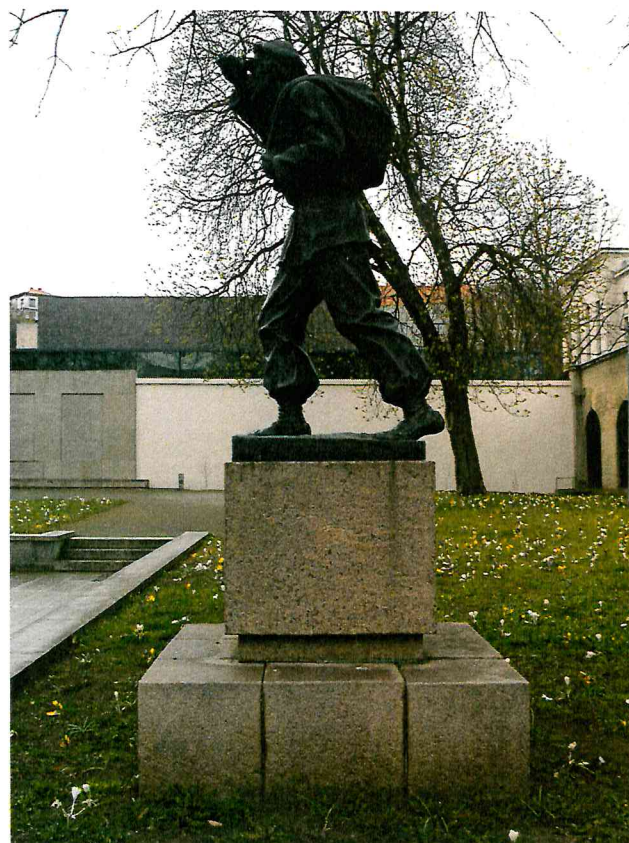
2 pav. Skulptūros vaizdas iš dešinės pusės