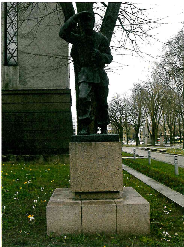
1 pav. Skulptūros vaizdas iš priekio