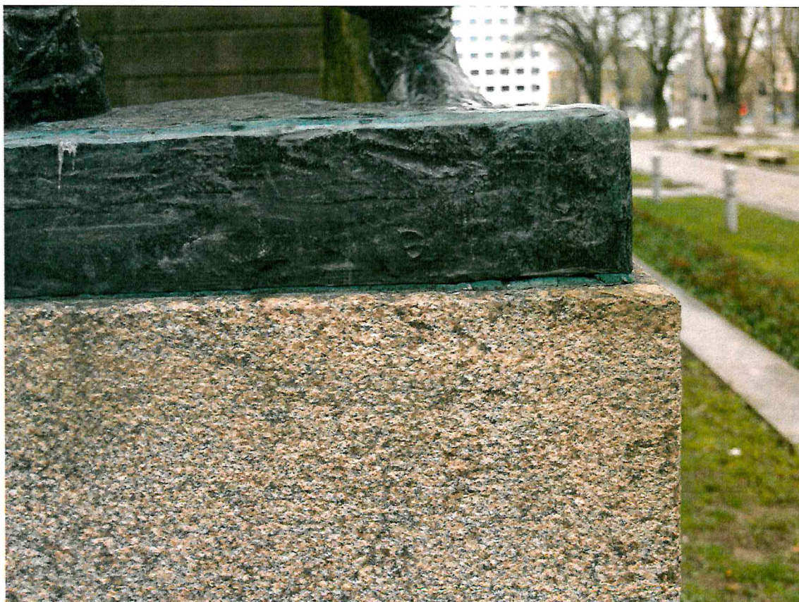
6 pav. Tarp esamo hermetiko ir bronzinės skulptūros dalies matomi plyšiai