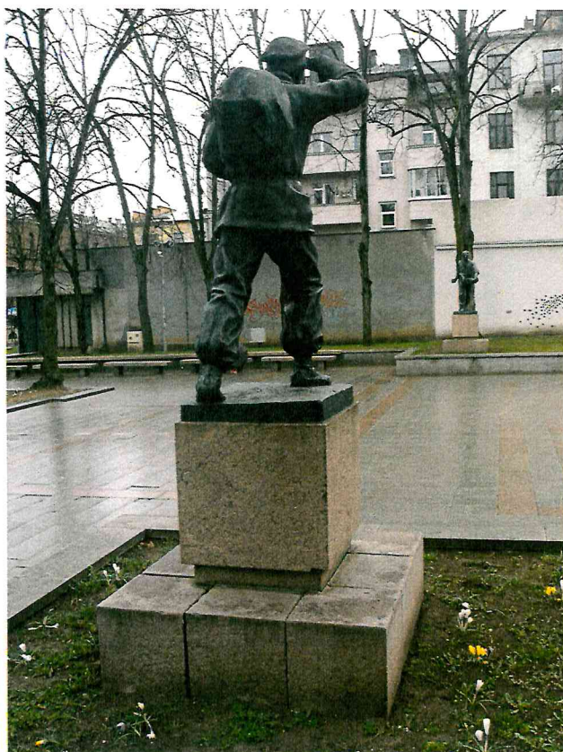
3 pav. Skulptūros vaizdas iš galinės pusės. Matomas nuskeltas postamento kampas apačioje