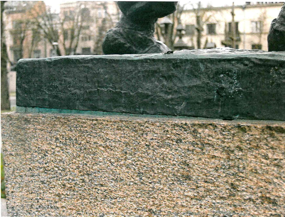
5 pav. Esamas hermetikas nebėra sandarus. Siūlę būtina hermetizuoti iš naujo