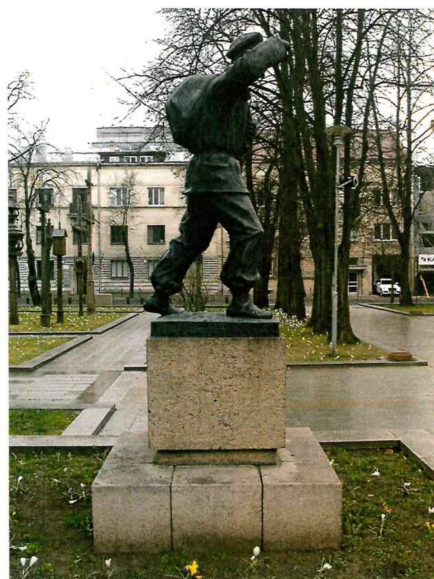
4 pav. Skulptūros vaizdas iš kairės pusės