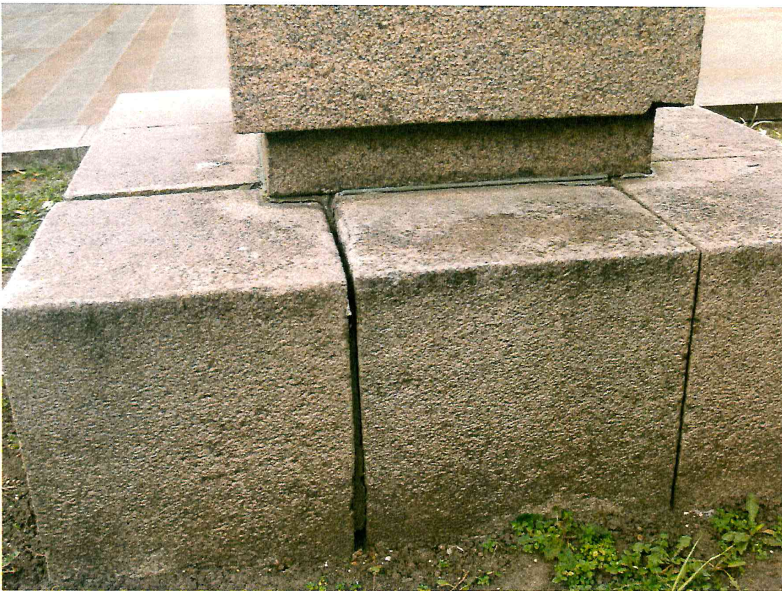
8 pav. Atviros siūlės skulptūros cokolyje. Vietomis siekia iki 20 mm