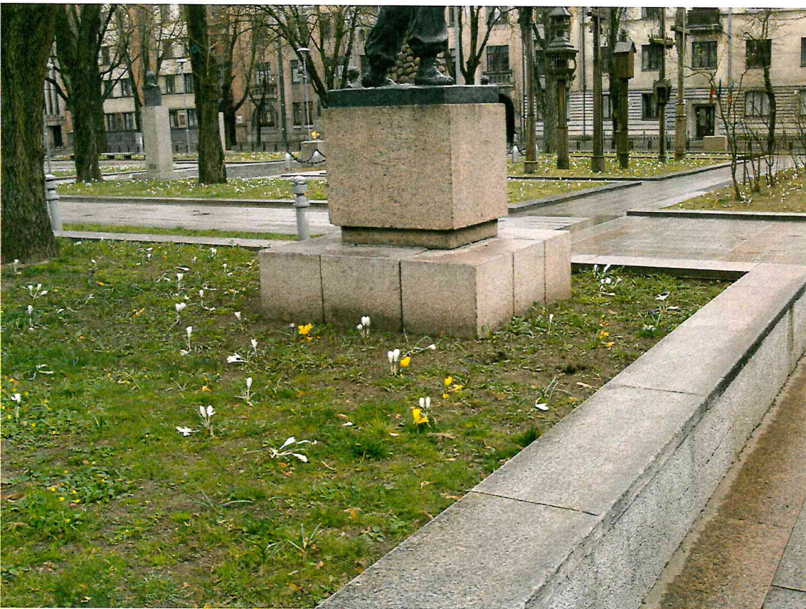
10 pav. Tarp skulptūros ir atraminės sienelės, ties pastarosios kampu, rekomenduojama pakelti augalinį žemės sluoksnį, sulyginant reljefą aplink skulptūrą