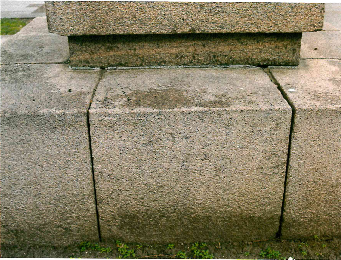
9 pav. Atviros siūlės skulptūros postamentMatomos žalsvos apnašos