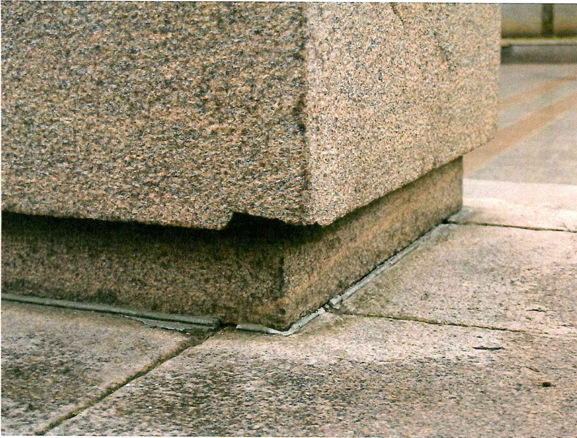
7 pav. Nuskeltas granitas ties postamento apatiniu kampu