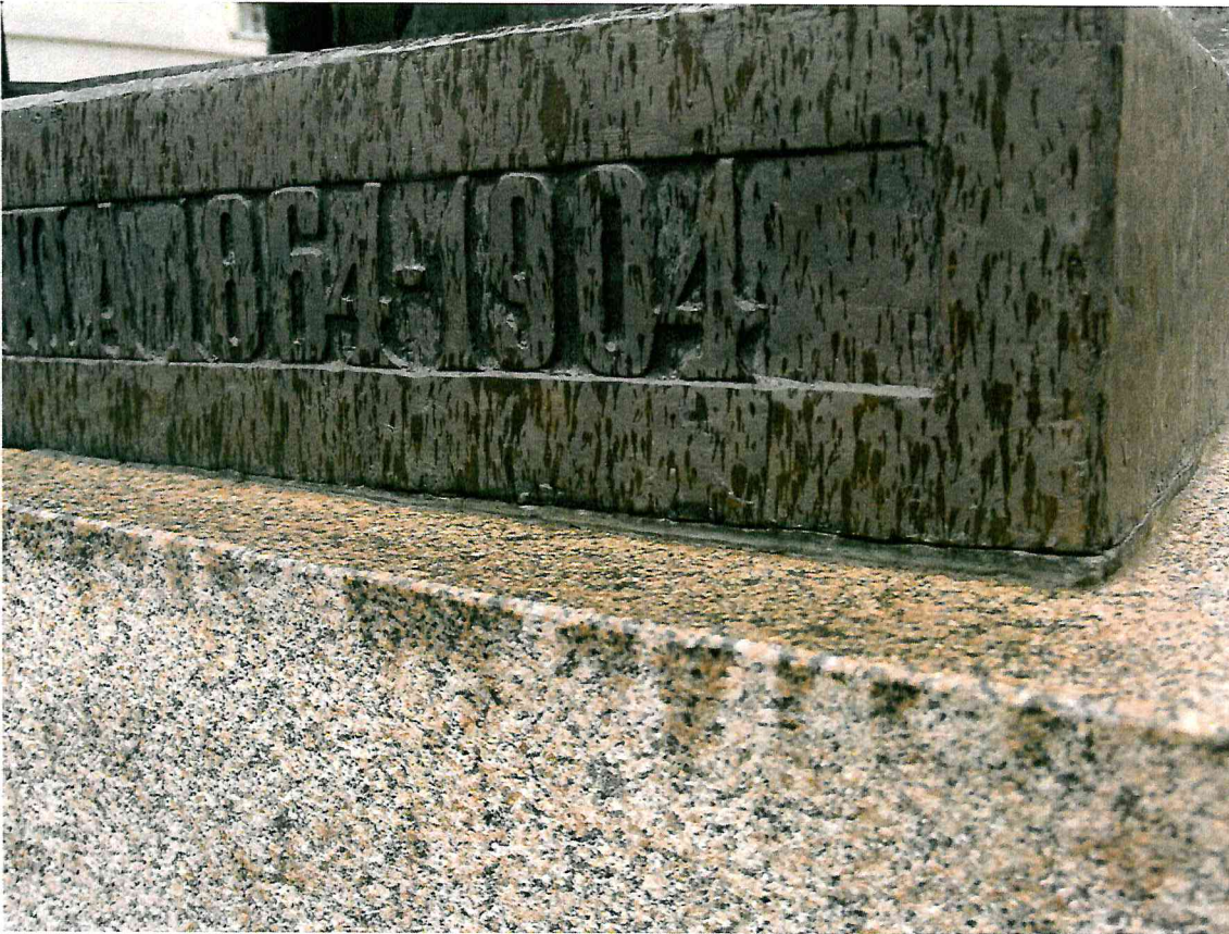
5 pav. Esamas hermetikas nebēra sandarus. Siūļē būtina hermetizuoti iš naujo