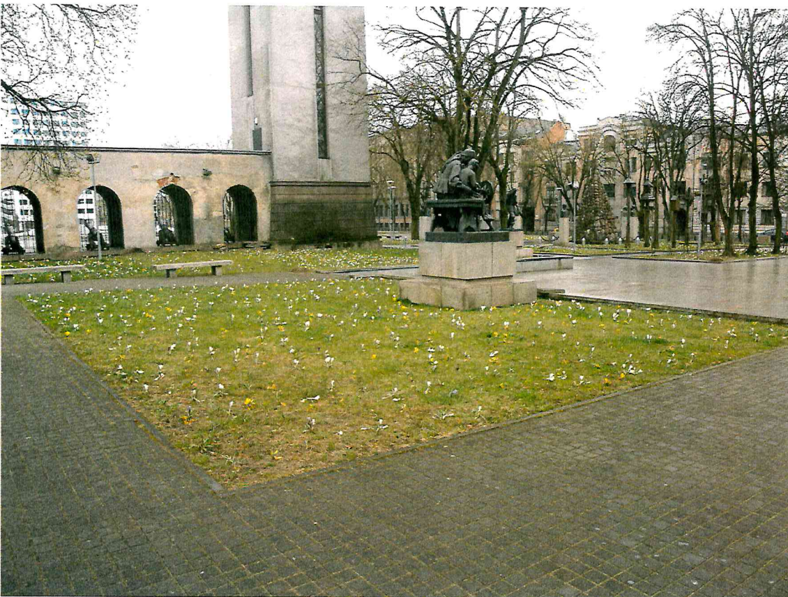
11 pav. Skulptūros aplinka yra tvarkinga ir nuolat prižiūrima