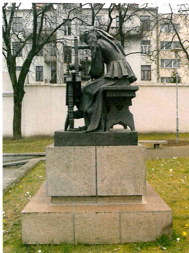
2 pav. Skulptūros vaizdas iš dešinės pusės