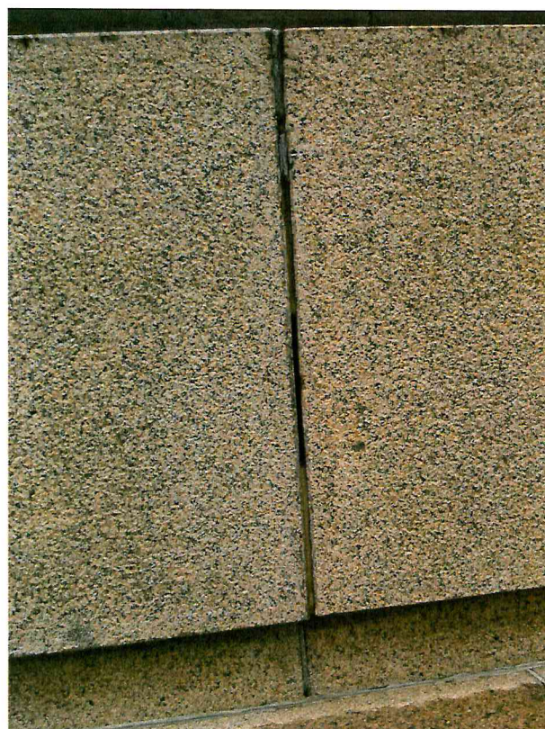
9 pav. Atviros siūlės skulptūros postamente