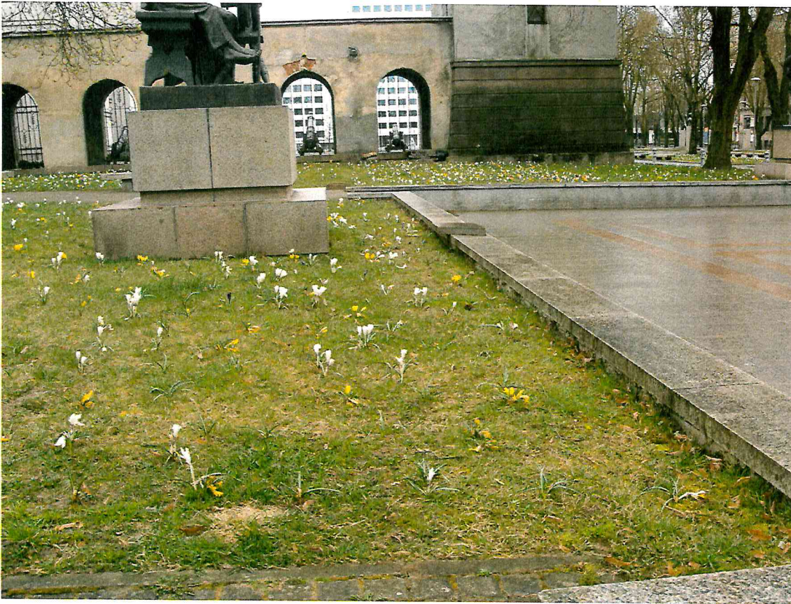
10 pav. Tarp skulptūros ir atraminės sienelės, priekinėje dalyje, rekomenduojama pakelti augalinį žemės sluoksnį, sulyginant reljefą aplink skulptūrą