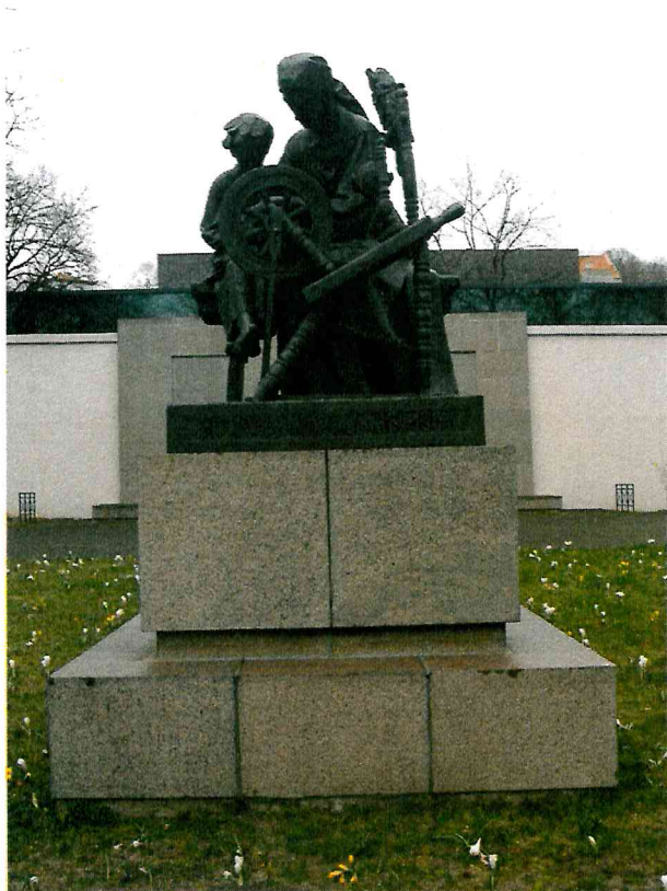
1 pav. Skulptūros vaizdas iš priekio