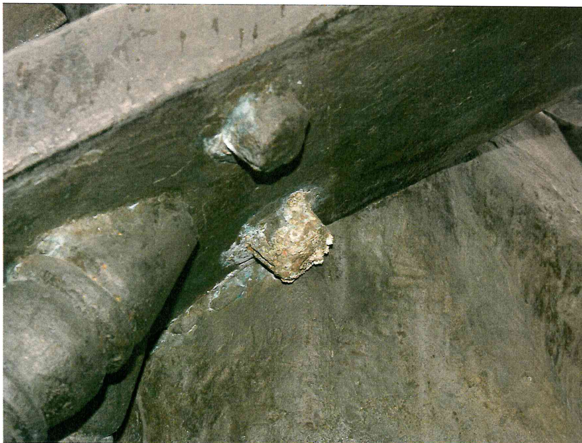
7 pav. Bronzinėje skulptūros dalyje yra vietų, kur korozijos pažeistas vietas reikia tvarkyti