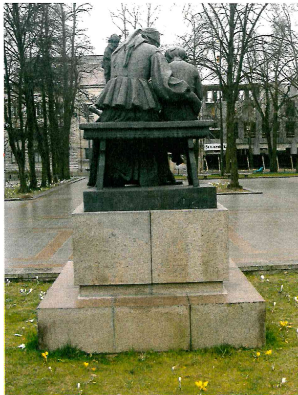
3 pav. Skulptūros vaizdas iš galinės pusės. Matomi patamsėjimai ir žalsvos apnašos cokolyje