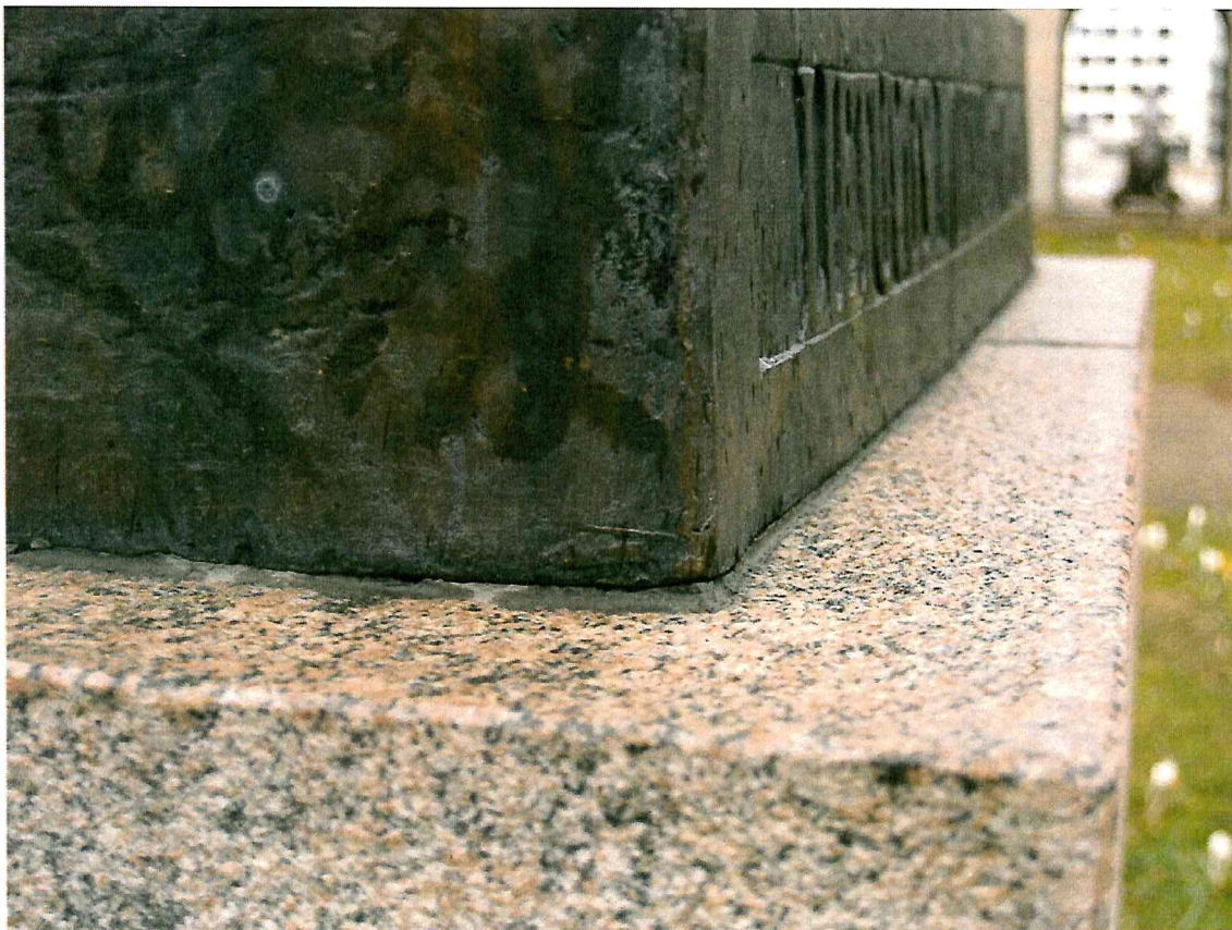
6 pav. Tarp esamo hermetiko ir bronzinēs skulptūros dalies matomi plyšiai