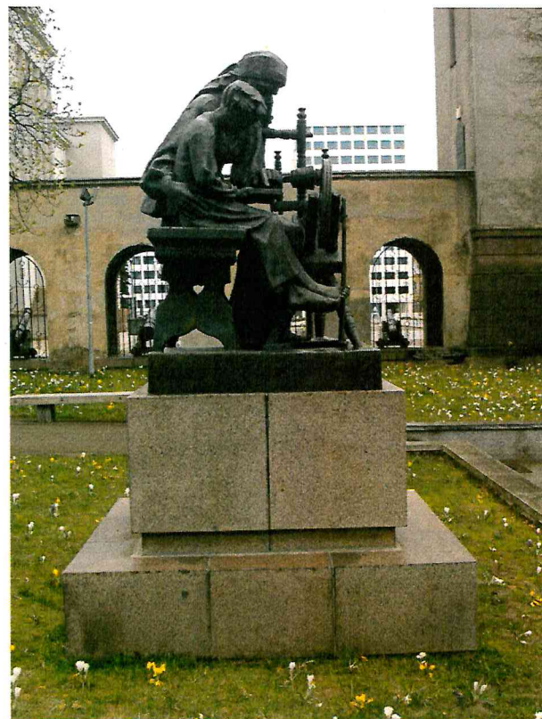
4 pav. Skulptūros vaizdas iš kairės pusės. Matomi patamsėjimai cokolyje