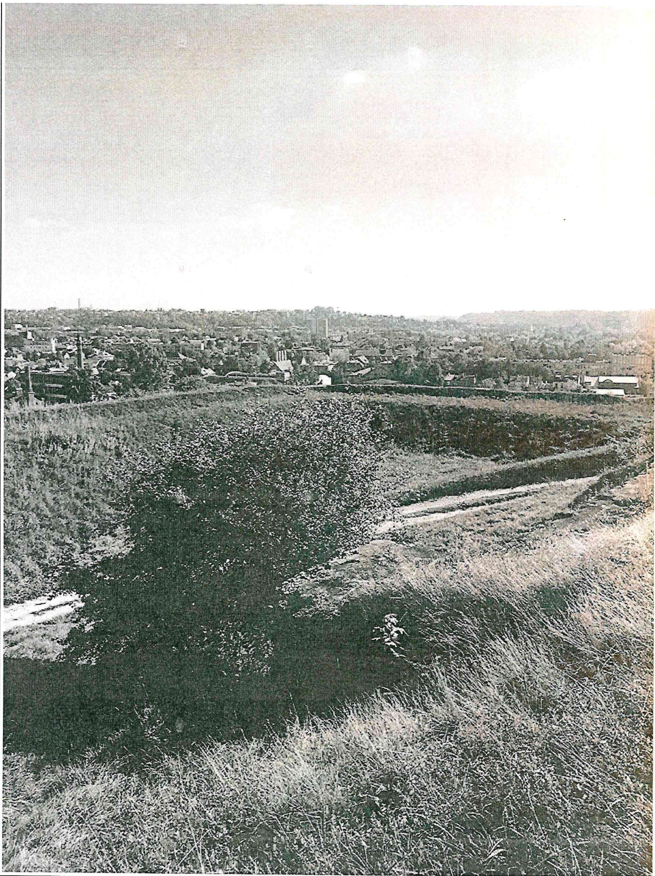
Nr. 4 Pavadinimas Antras redutas Data 2019-09-27