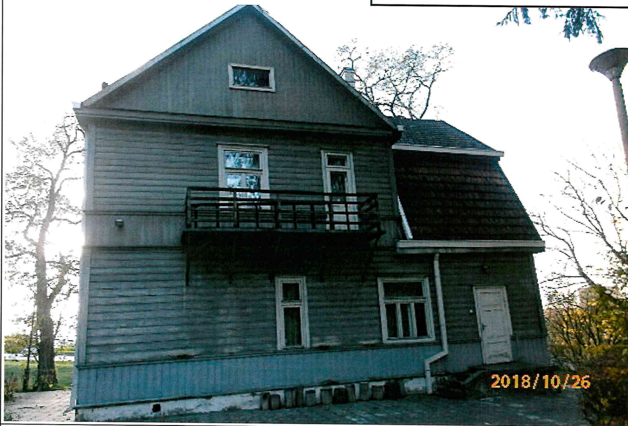
Nr. 7 Pavadinimas ŠR fasadas