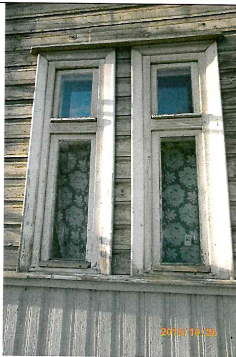
Nr. 8 Pavadinimas Langu fragmentas