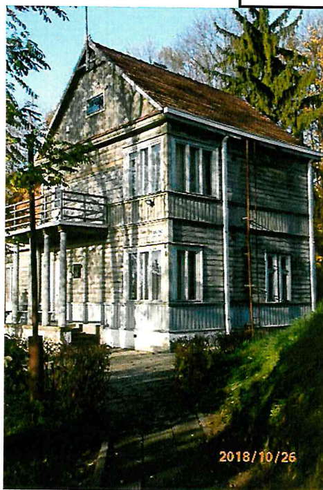
Nr. 1 Pavadinimas PV ir PR fasadai