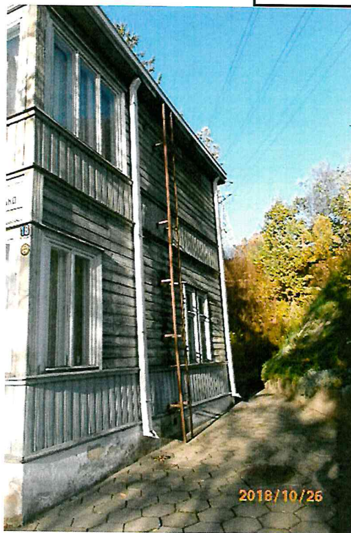
Nr. 9 Pavadinimas PR fasadas