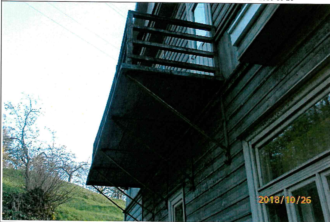
Nr. 6 Pavadinimas Balkonas iš kiemo pusės