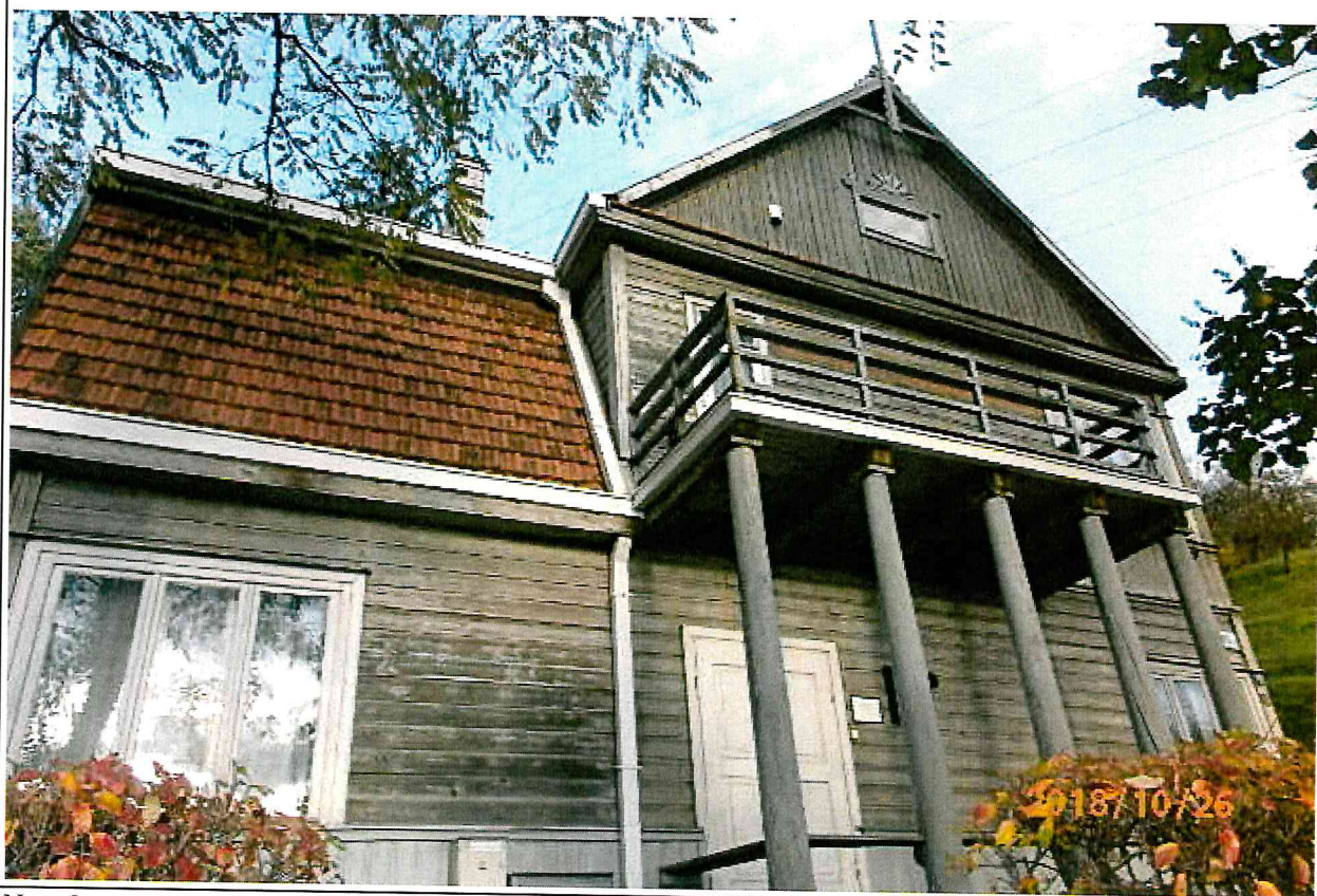
Nr. 2 Pavadinimas PV fasado fragmentas