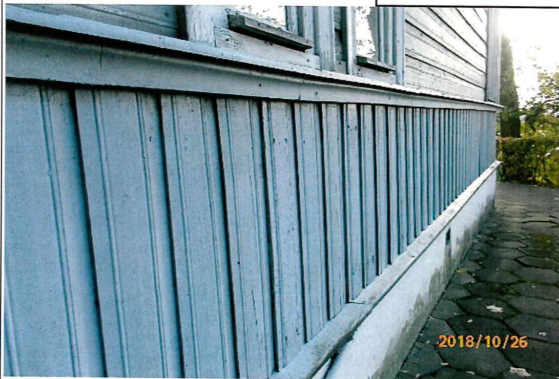
Nr. 5 Pavadinimas ŠV fasado vertikalų ir horizontalių lentelių fragmentas Data 2018-10-26