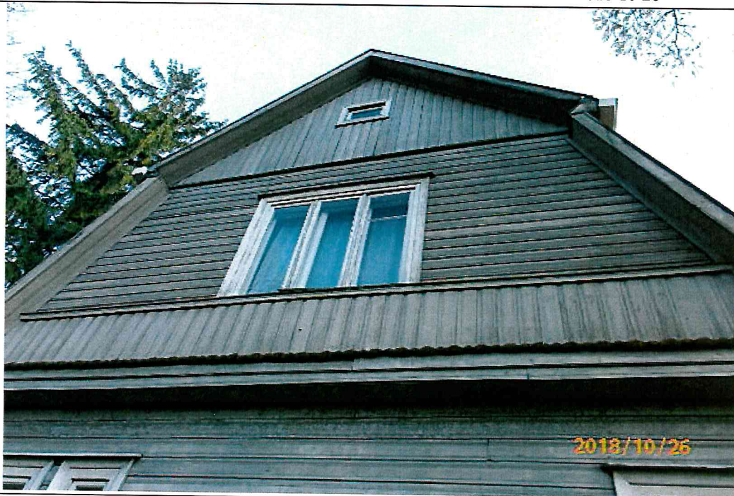
Nr. 4 Pavadinimas ŠV fasado dalies fragmentas