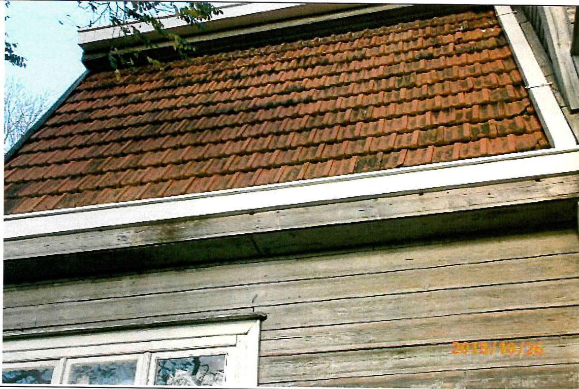
Nr. 10 Pavadinimas PV fasado stogo fragmentas