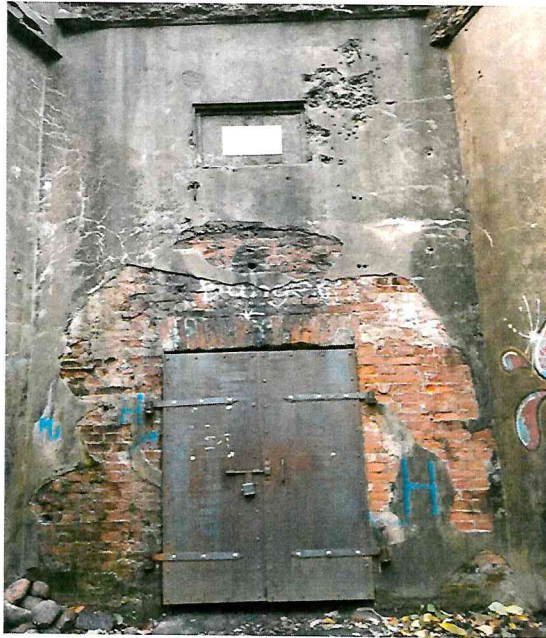
Nr. 3 Pavadinimas Įėjimo fragmentas