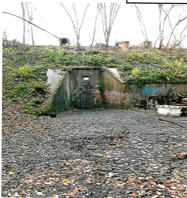
Nr. 1 Pavadinimas PR fasado fragmentas