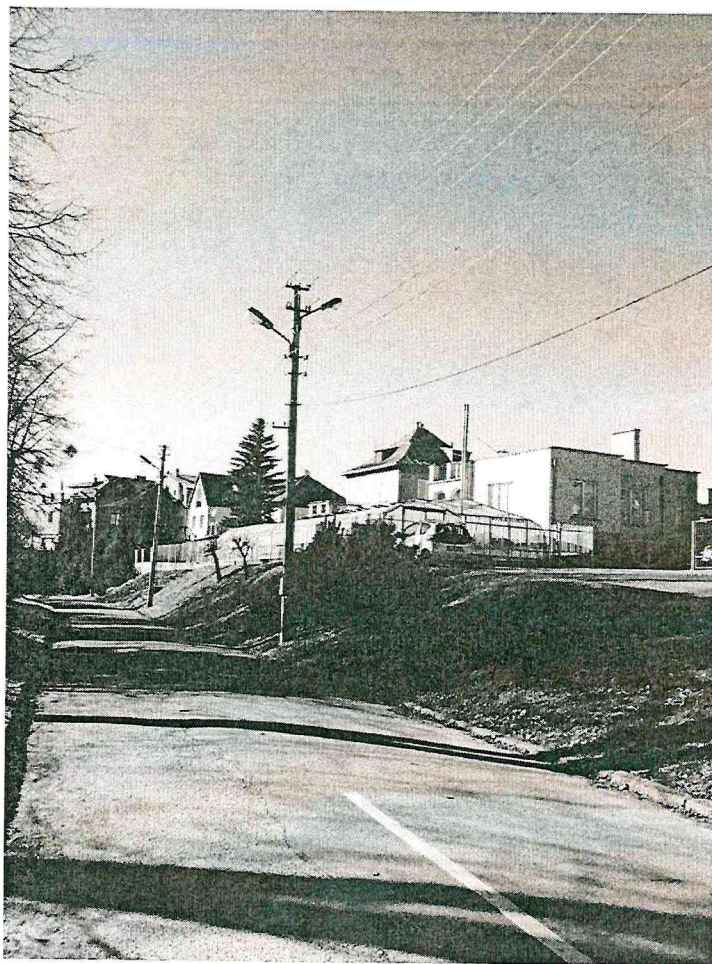
13.1. Vaizdas iš R pusės (F-1)