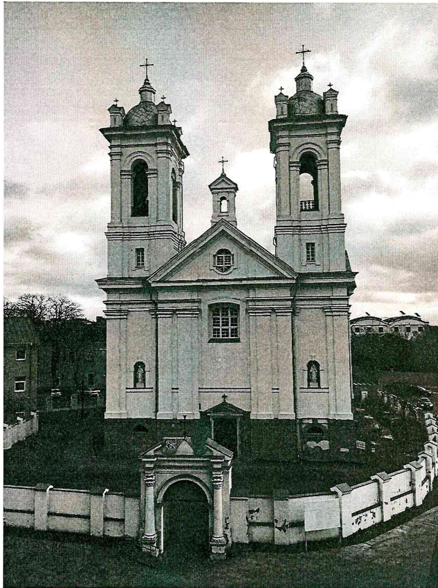
Šv. Kryžiaus bažnyčia ir šventoriaus vartai (F-1)

Kultūros vertybės kodas 1128. Fotografavo Deimantė Vieraitytė . Data 2017-12-12