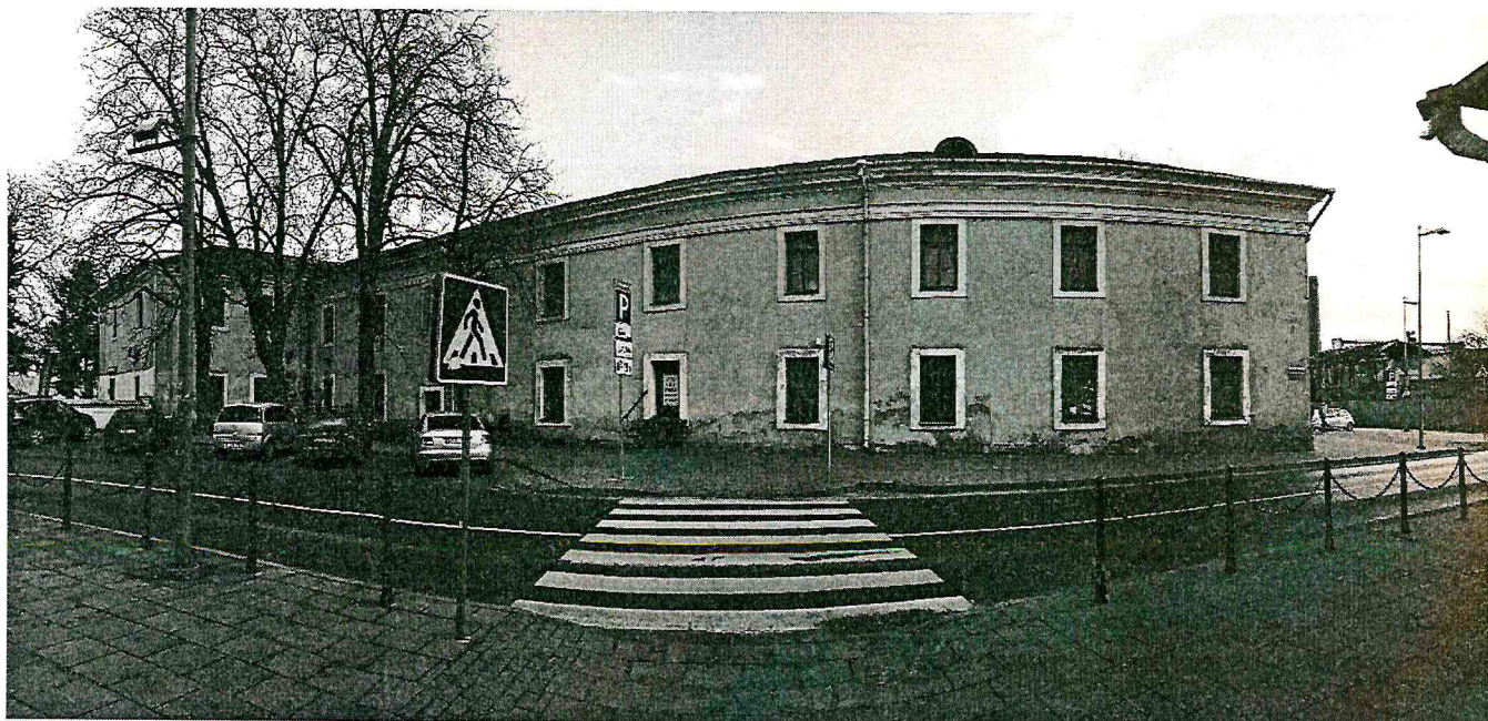
Vienuoyno namas nuo Gedimino g. pusės (F-2)