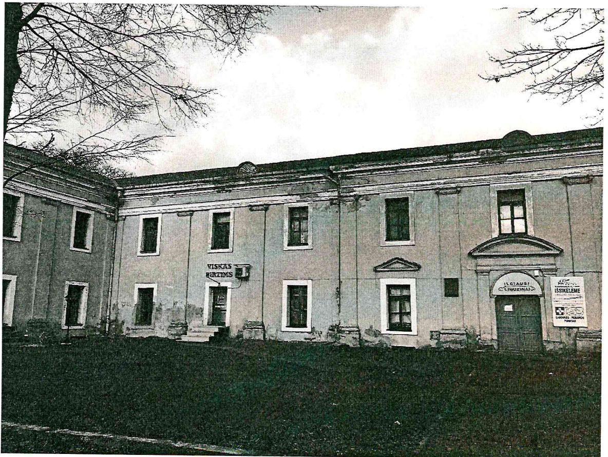
Vienuolyno namo centrinės dalies PV fasadas (F-6)