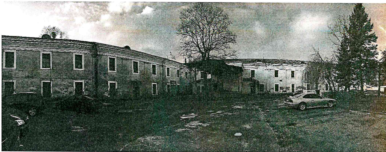
Vienuolyno namas iš vidinio kiemo pusės (F-3)