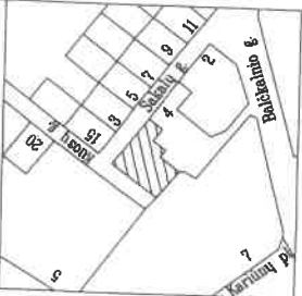
Žemės sklypo išdėstymo schema