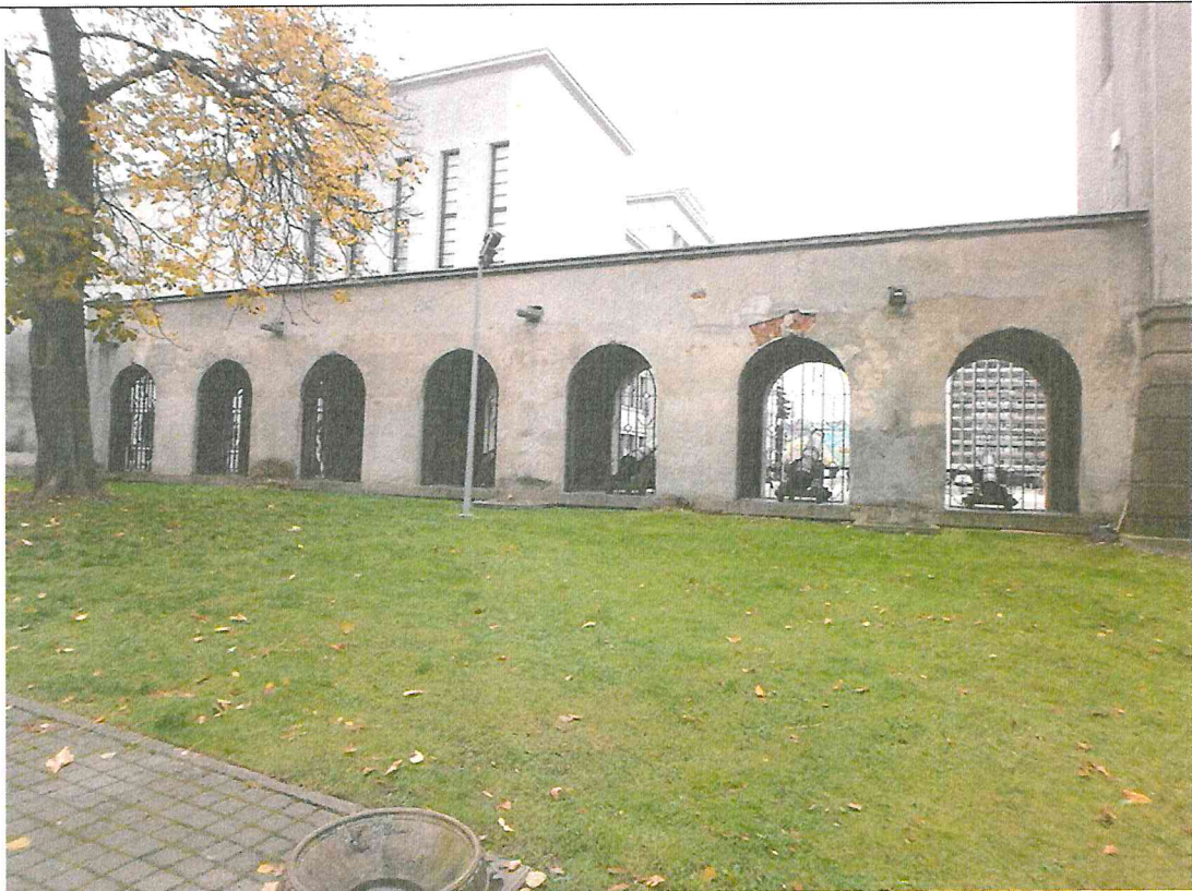
Nr. 2 Pavadinimas Galerijos V fasado frgmentas Fotografavo