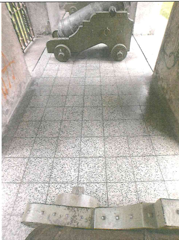
Nr. 4 Pavadinimas Galerijos grindinio fragmentas Data 2017-11-07