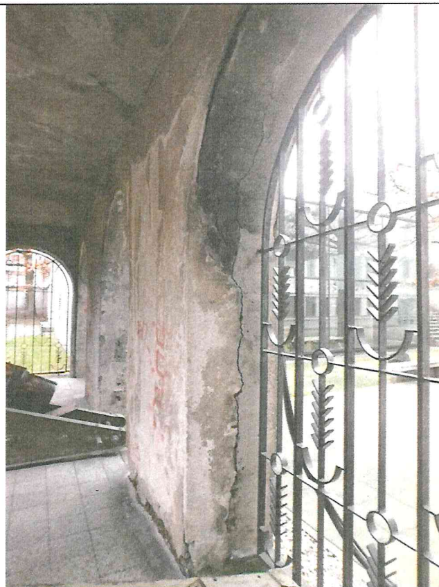
Nr. 8 Pavadinimas Tinko fragmentas