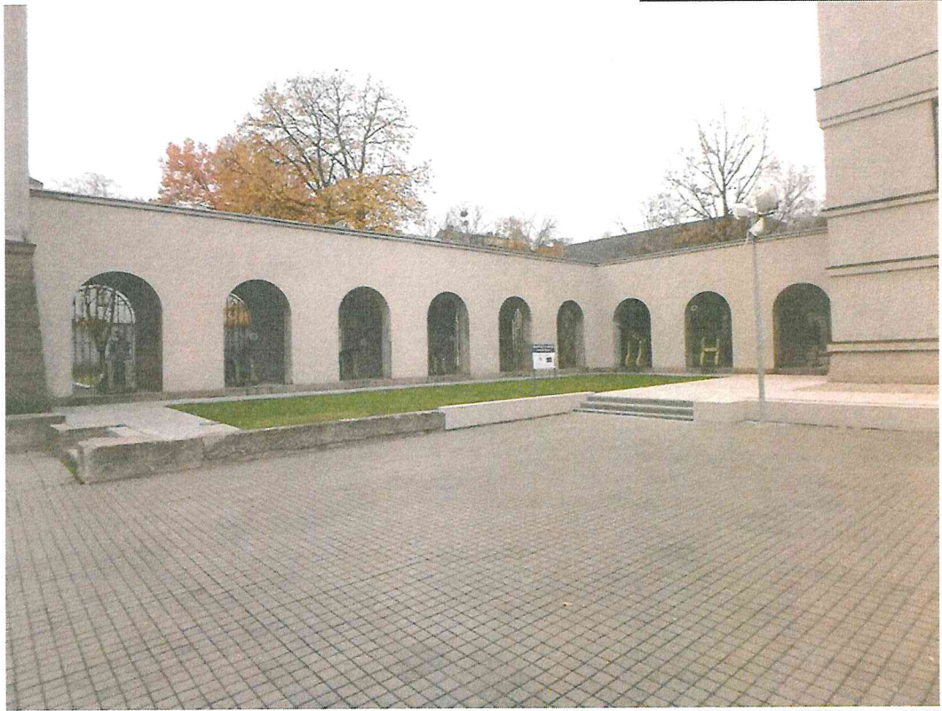
Nr. 1 Pavadinimas Galerija iš PR pusės