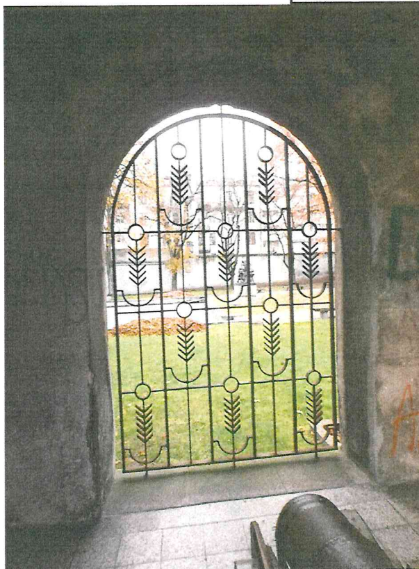
Nr. 3 Pavadinimas Arkos, dekoratyvių metalo grotų fragmentas Data 2017-11-07