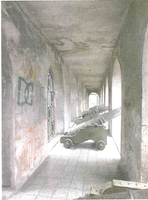
Nr. 5 Pavadinimas Galerijos vidaus fragmentas