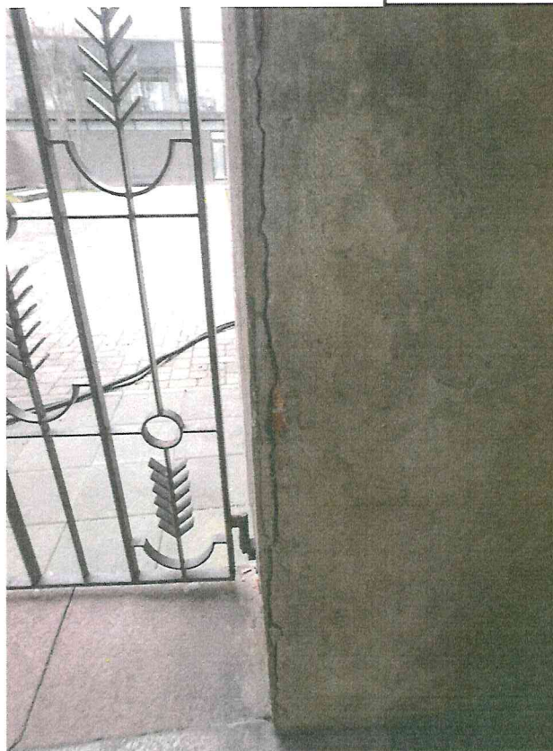
Nr. 7 Pavadinimas Tinko fragmentas