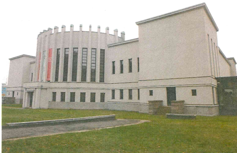
Nr. 3 Pavadinimas Muziejaus rūmų Š fasadas