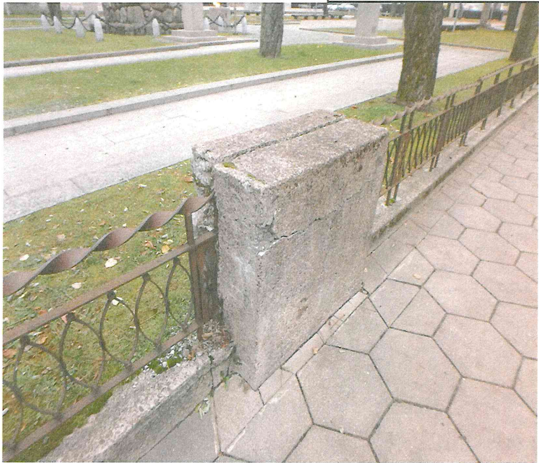
Nr. 11 Pavadinimas Tvorelės fragmentas P dalyje