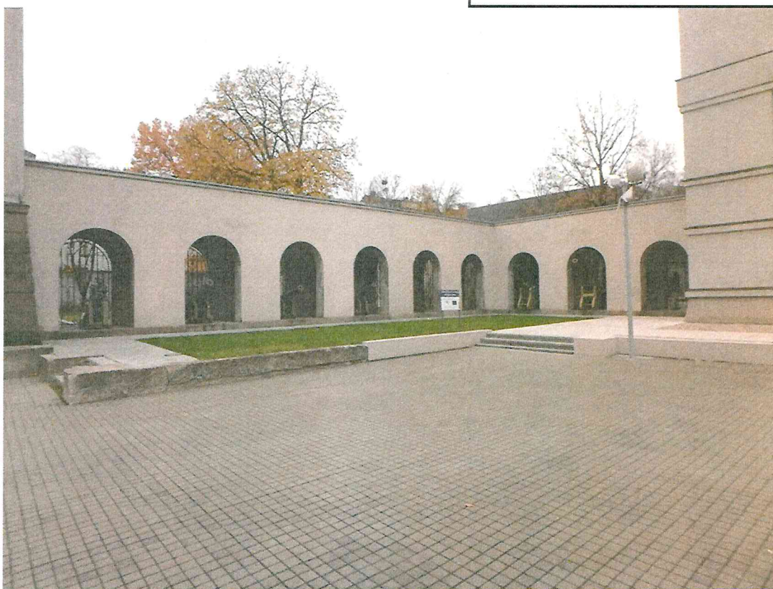
Nr. 5 Pavadinimas Galerijos fragmentas