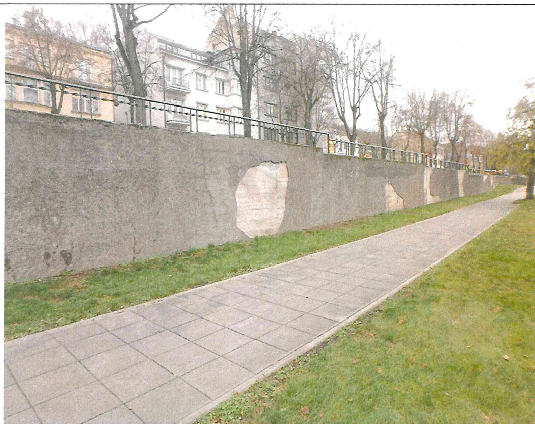
Nr. 10 Pavadinimas Tinkuoto betono tvoros su metalo turėklais fragmentas Š dalyje Data 2017-11-07