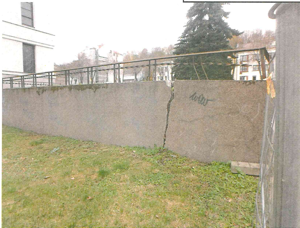
Nr. 9 Pavadinimas Tinkuoto betono tvoros su metalo turėklais fragmentas Š dalyje Data 2017-11-07