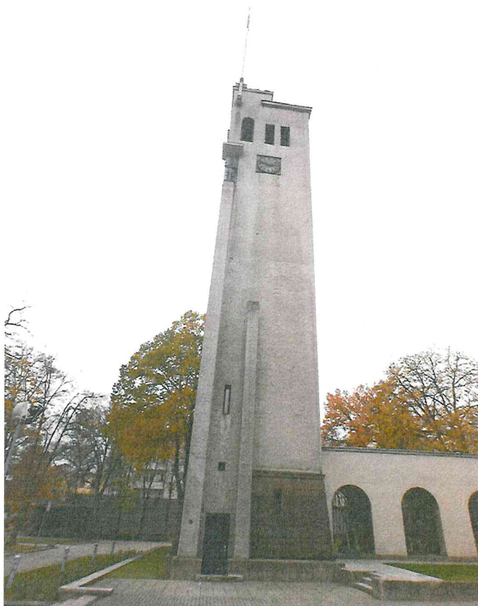
Nr. 4 Pavadinimas Kariliono ir laikrodžio bokštas