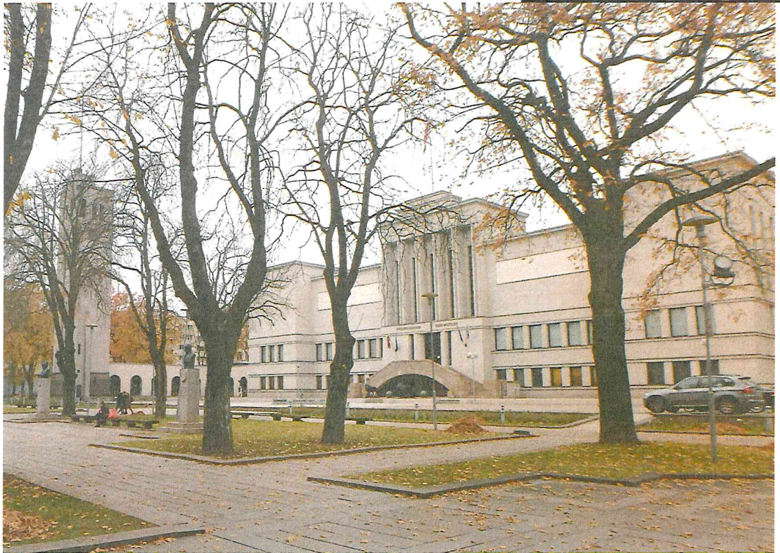
Nr. 1 Pavadinimas Muziejų rūmų, galerijos bei kariliono ir laikrodžio bokšto fragmentas Data 2017-11-07