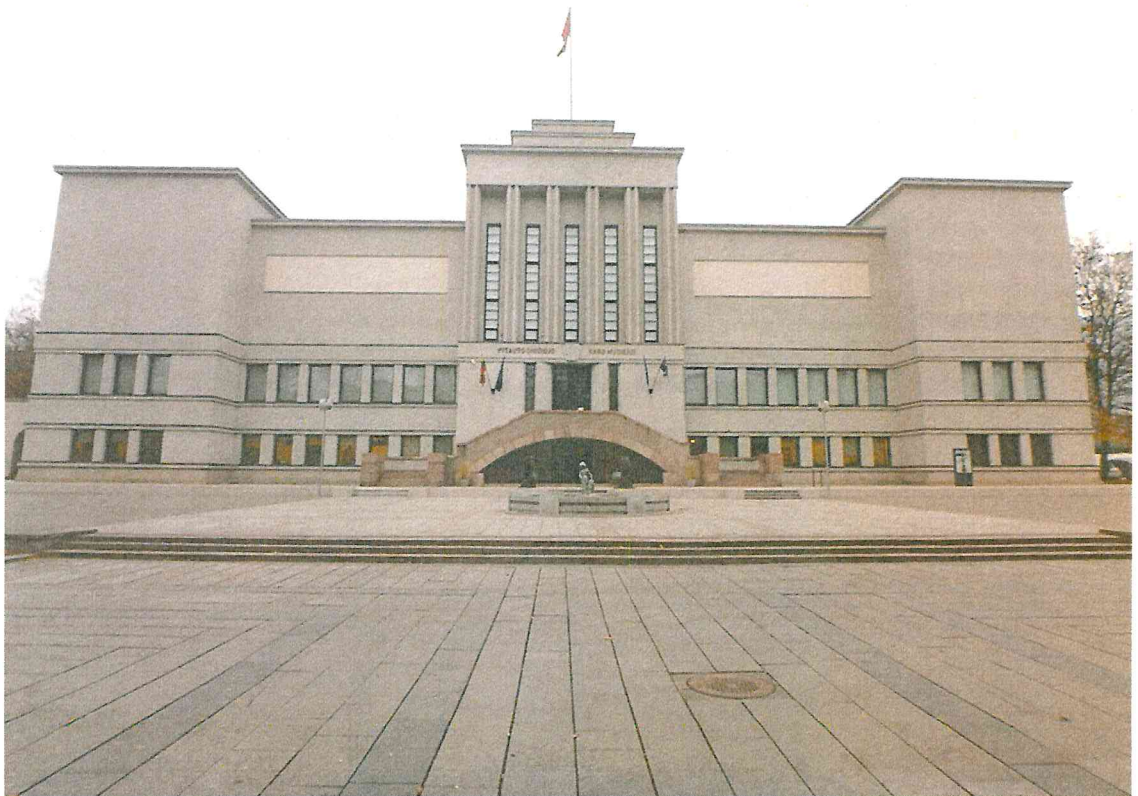
Nr. 2 Pavadinimas Muziejaus rūmų P fasadas Fotografavo