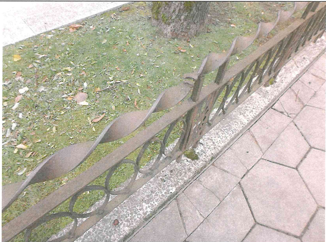
Nr. 12 Pavadinimas Tvorelės fragmentas P dalyje