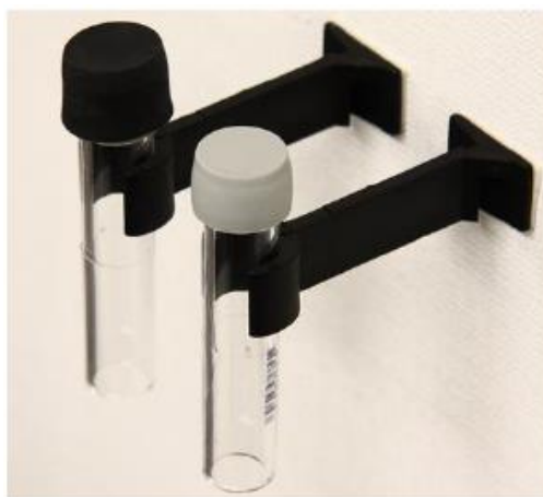
2 pav. NO 2 pasyvus sorbentas

Pasyvių sorbentų pagalba gautos vidutinės teršalų koncentracijos buvo lyginamos su atitinkamo teršalo vidurkinimo periodo ribinėmis vertėmis apibrėžtose teisės aktuose: