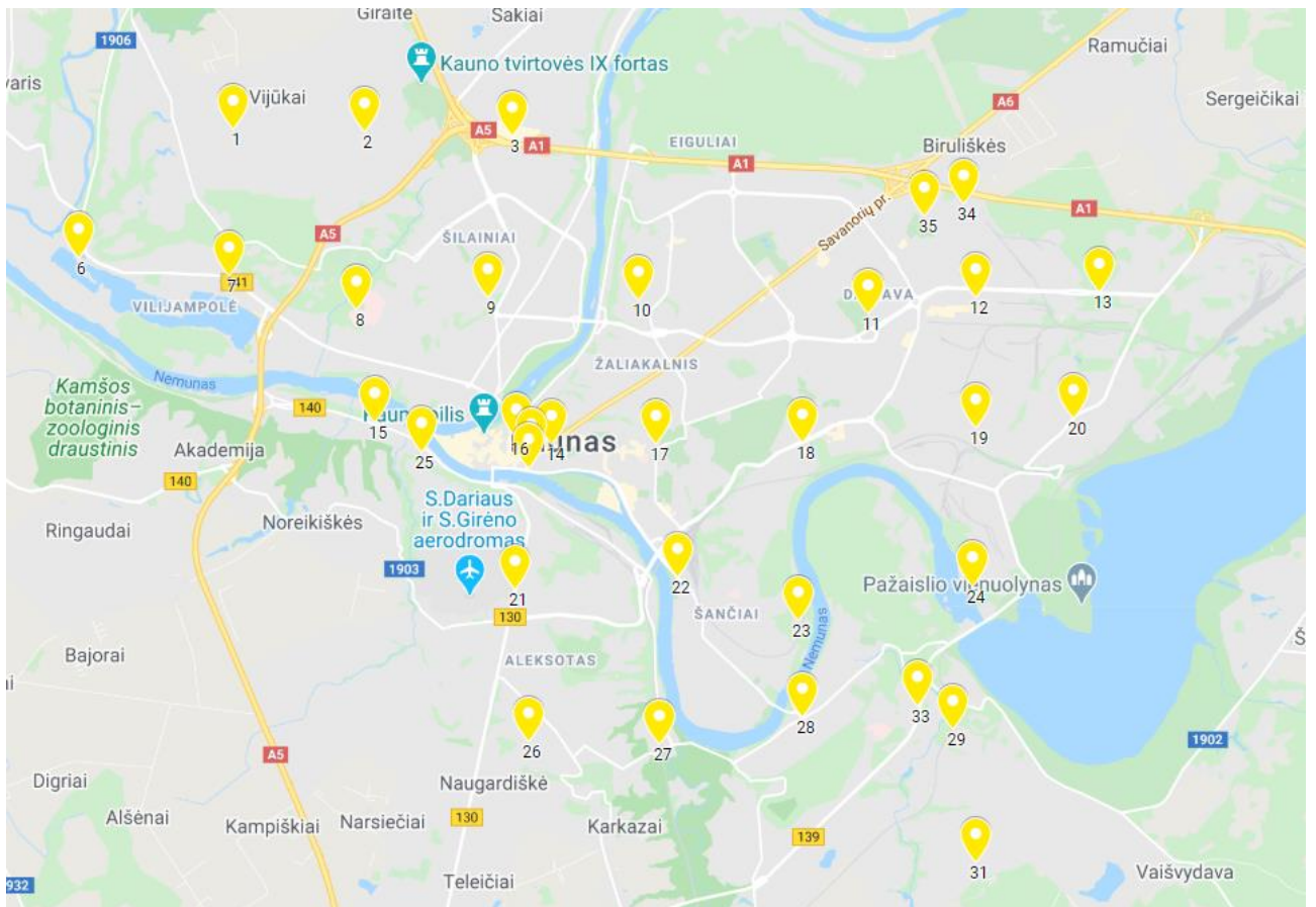
1 pav. NO 2 pasyvių sorbentų lokalizacijos vietų vizualizacija Kauno miesto savivaldybės teritorijoje