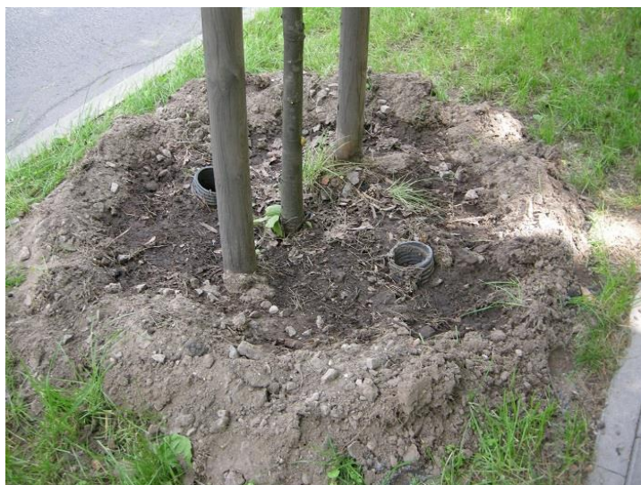
12 pav. Tinkamai pasodinti nauji medžiai

Dar vienas svarbus darbas atliktas siekiant padidinti medžių ilgaamžiškumą, tai kamieno pagrindo apsaugos nuo sužalojimo. Labai gerai, kad šios apsaugos yra ne iš ištisinio lakšto. Tokiu būdu kamieno pagrindas gali kvėpuoti, aplink nesikaupia įvairios sąnašos (ypatingai sunešamos skruzdžių) (13 pav.).