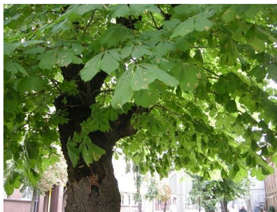
2 pav. Keršosios kaštoninės klandelės pažeidimai rugpjūčio mėnesį (daugumoje labai silpni pakenkimai).