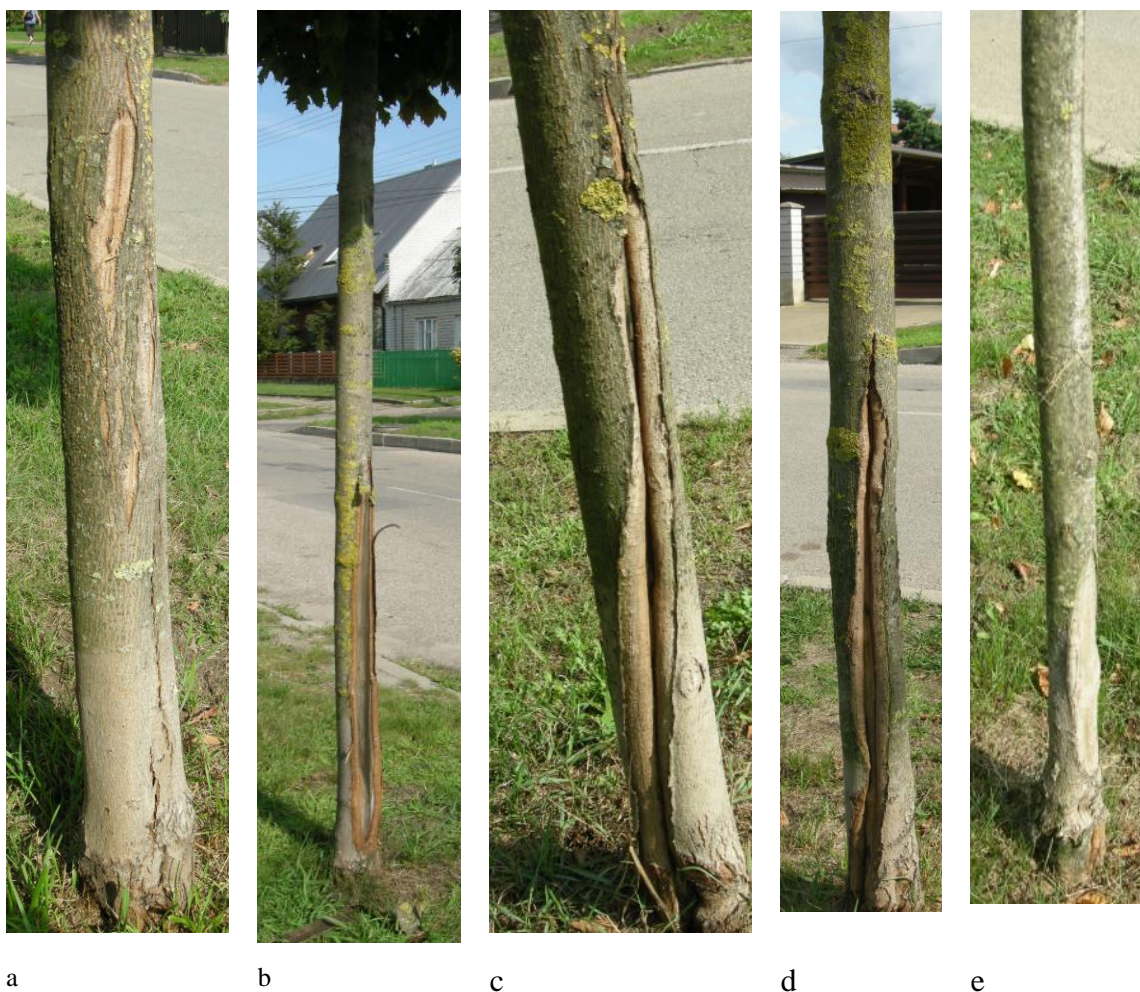
11 pav. Naujai pasodintų medžių kamienų sužalojimai

Atliekant naujai pasodintų medžių kamienų būklės stebėseną matomi ne tik žmogaus padaryti sužalojimai (11 pav. b, c, d, e), bet ir suskilusi kamienų žievė dėl oro temperatūros svyravimų žiemos pabaigove-pavasario pradžioje (11pav. a). Žmogaus sužalojimai nėra dažni. Žaizdos gyja. Sudėtingiau jei žoliapjove pažeidžiami kamienų pagrindai, tuomet didelė tikimybė, kad pateks infekcija ir sutrumpins medžio amžių. Pavojinga situacija yra Darbininkų gatvėje, kur daugelio naujai pasodintų paprastųjų klevų „Globosum“ sužaloti kamienų pagrindai. Jie po truputį gyja, bet pasekmės liks. Pastaruoju metu pagerėjo situacija dėl kamienų pagrindų žalojimo pjaunant žolę (10 pav.).