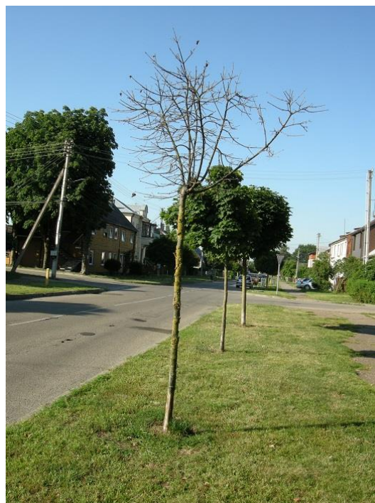
8 pav. Reikia atsodinti vietoj sunykusių naujų medelių.