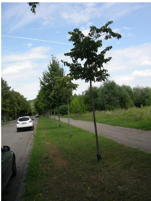
7 pav. Naujiems medeliams būtinas savalaikis genėjimas

Neigiamai medžiams pasireiškia žmogaus poveikis darant dideles žaizdas formuojant lają nesavalaikiai genint. Todėl reikia atkreipti dėmesį į atskiras šakutes, kurios dar gana nedidelės, bet dako lajos formą (Kapsų g. ir kt.) arba yra nudžiūvusios šakų (7 Pav.). Daugelyje gatvių Kaune (Vytauto per., Smetonos al., Miško g. ir kt.) šis darbas yra atliekamas savalaikiai (9 pav.). Kai kuriose gatvėse (Aušros, Gervių ir kt. ), yra jau ne pirmi metai nauji žuvę medeliai. Juos reikia atsodinti (8 pav.).