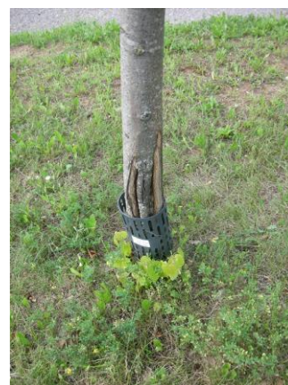
10 pav. Kamienų pagrindai sužaloti žoliapjove.