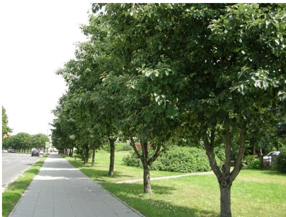
3 pav. Nuolat geros būklės Breslaujos gatvėje augantis švedinis šermukšnis.