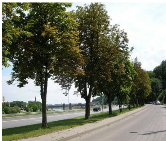
1 pav. Marvelės gatvėje augantys paprastieji kaštonai pažeisti nekrozės.

Atliekant želdinių stebėseną 2018–2020 metais apsauginiuose gatvės želdiniuose buvo nepažeisti: platanalapis klevas ( Acer pseudoplatanus ), paprastasis lazdynas ( Corylus avellana ), paprastoji pušis ( Pinus sylvestris ), rūgštusis žagrenis ( Rhus typhina ), baltažiedė robinija ( Robinia pseudoacacia ), baltasis gluosnis ( Salix alba ‘Tristis’), paprastosios alyvos ( Syringa vulgaris ), o rekreaciniuose: paprastasis klevas ( Acer platanoides ), platanalapis klevas ( Acer pseudoplatanus ), sidabrinis klevas ( Acer saccharinum ), paprastasis lazdynas ( Corylus avellana ), europinis ožekšnis ( Euonymus europaeus ), žaliasis uosis ( Fraxinus lanceolata ), ziboldo obelis ( Malus toringo ), baltasis šilkmedis ( Morus alba ), raudonasis ažuolas ( Quercus rubra ), vėlyvoji ieva ( Padus serotina ), amūrinis kamštenis ( Phellodendron amurense ), drebulė ( Populus tremula ), blindė ( Salix caprea ), didžialapė liepa ( Tilia platyphyllos ), paprastasis putinas ( Viburnum opulus ).