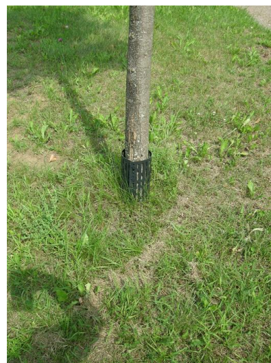
13 pav. Kamienų apsaugos