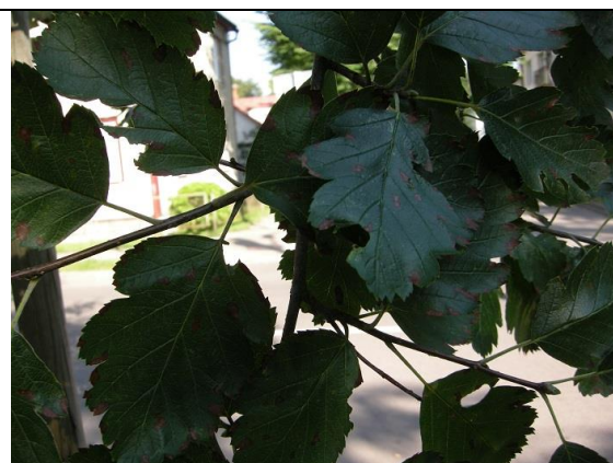
15 pav. Švedinis šermukšnis „Browers“ pažeistas rauplių.