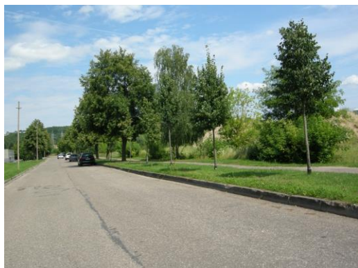
5 pav. Gervių gatvėje Nauji medžiai tarp brandžių Gervių gatvėje.

ginkmedžio, beržo), 12 rūšių ir 9 veislių jauni medžiai (6 lentelė). Didžioji jų dalis yra geros būklės. Išaiškėjo, kad kaip ir kituose Lietuvos miestuose, mūsų gatvių želdynams netinkami yra tik paprastojo kaštono 'Baummannii' veislės medžiai. Nauji medžiai sodinami keičiant senus medžius visoje gatvėje (Juozapavičiaus pr., Islandijos pr., Darbininkų, Miško, Vytauto, Zanavykų, Vaidoto ir kitose gatvėse) arba palaipsniui pasodinant tarp senų medžių naujus (Dovydaičio g., J. Basanavičiaus al., Gervių, T. Masiulio, R. Kalantos, Kalniečių ir kitose gatvėse) (5, 6 pav.).