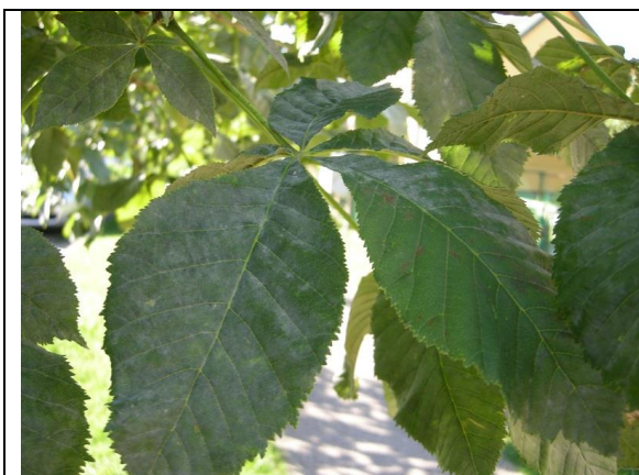
14 pav. Paprastasis kaštonas „Briotii“ pažeistas miltligės.

Naujai sodinamų augalų pomedis paruošiamas tinkamai: paliekama reikiamas neuždengtas plotas iki 1,5 m 2 , sodinama pievoje. Suplūkto pomedžio jau nėra (7 lentelė).