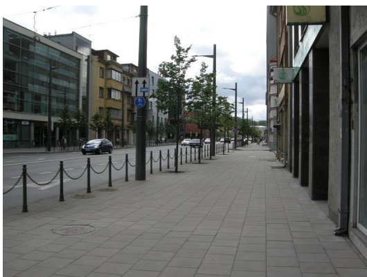
9 pav. Vytauto prospekte savalaikiai genimos