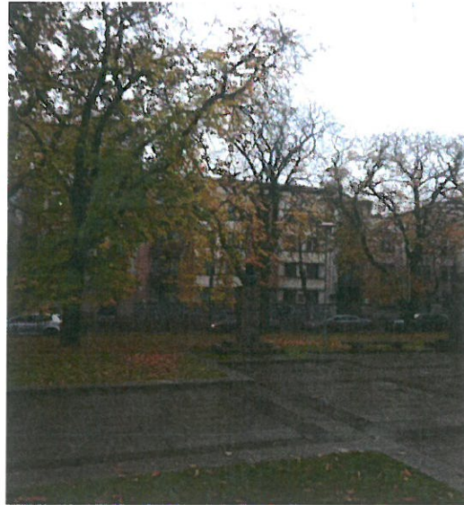
2022.10 mėn. dauguma kaštonų dar su lapais