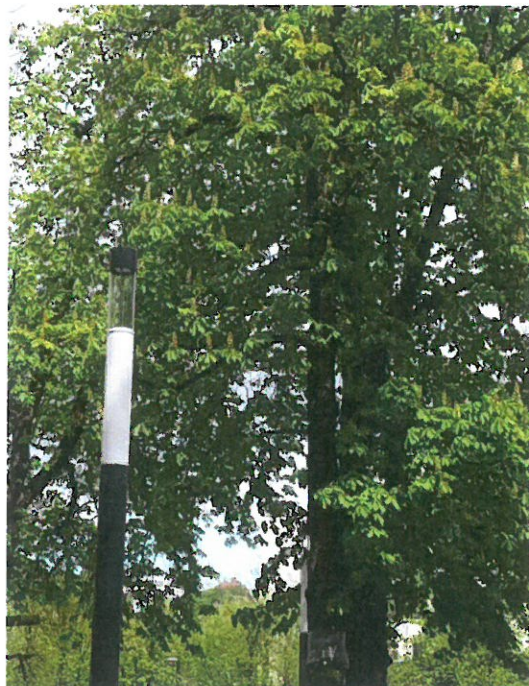
2022.06 mėn. stovis labai geras