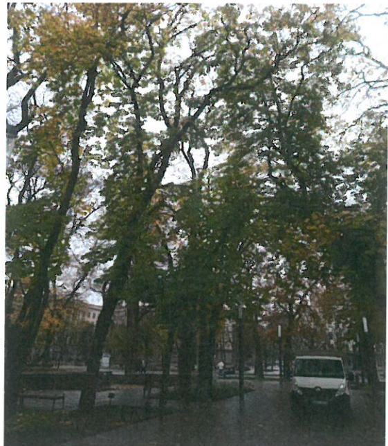
2022 m. 10 mėn. dauguma medžių laja dar su lapais

Nesaugomo kaštono prie Vytauto ir Kęstučio g. sankryžos vaizdas gegužės mėn. pradžioje, ir rugsėjo mėn. antroje pusėje