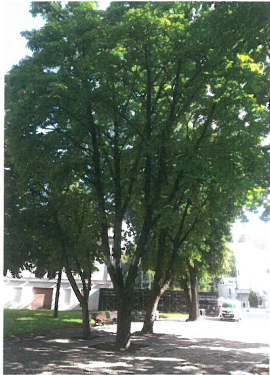
2022.07 mėn. Stovis geras pažeidimų labai mažai