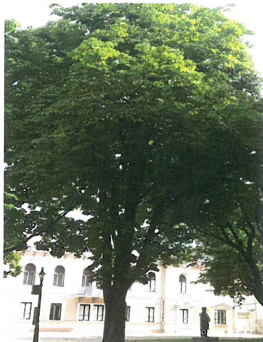
2022.08 mėn. Stovis geras pažeidimų nėra daug