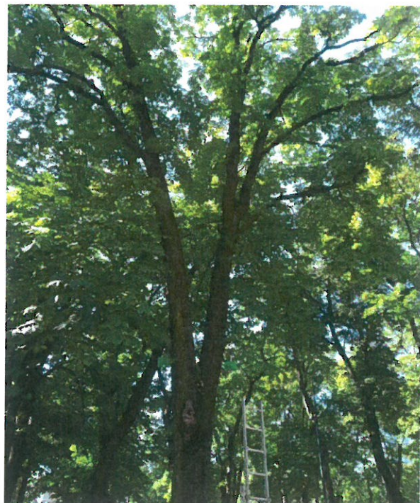
2022 m. 08 mėn. Stovis geras / ant atskirų medžių matomi maži pažeidimai