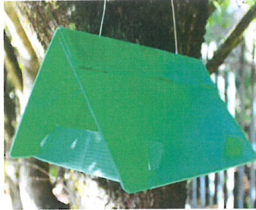
2 pav. Lajinės gaudyklės