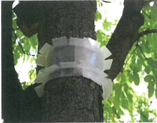
1 pav. Kamieninės gaudyklės