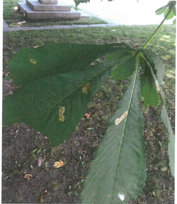
2022.07 mėn. Stovis geras pažeidimų mažai