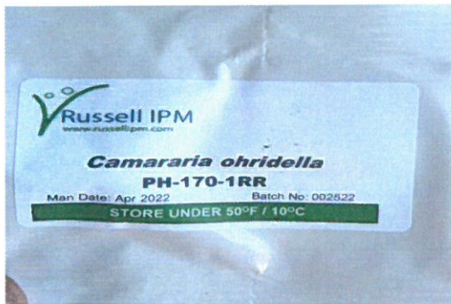
3 pav. Feromoninis masalas