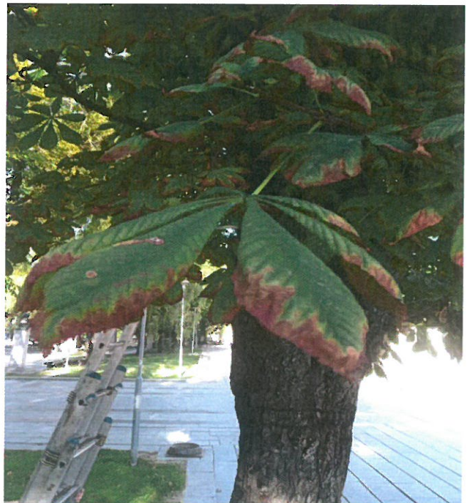
2022.08 mėn. Bendras stovis geras/ ryškus pakenkimai matomi tik ant atskirų medžių .