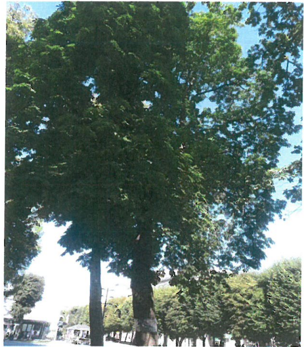
2022 m. 07 mėn. Stovis geras matomi pavieniai pažeidimai