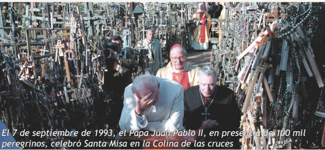
El 7 de septiembre de 1993, el Papa Juan Pablo II, en presencia de 100 mil peregrinos, celebró Santa Misa en la Colina de las cruces

Centro de información turística de Šiauliai junto a la Colina de las cruces Pueblo de Jurgaičiai, distrito municipal de Meškuičiai, 81439 región de Šiauliai, tel. +370 41 370860, E-mail turizmas@šiauliai-r.sav.lt