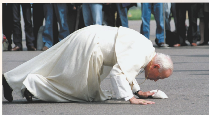
4 de septiembre de 1993. El Papa Juan Pablo II besa la tierra de Lituania en el aeropuerto de Vilnius.

Los creyentes de Lituania fueron homenajeados, y con la conmemoración de los 2000 años de la cristiandad, los lituanos pudieron celebrar los días del aniversario en Roma. No todas las naciones recibieron este privilegio.