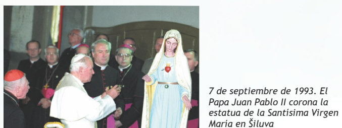
7 de septiembre de 1993. El Papa Juan Pablo II corona la estatua de la Santísima Virgen María en Šiluva.