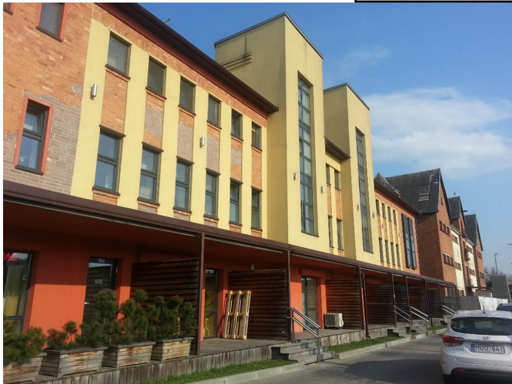
Nr. 1 Pavadinimas Pienocentro centrinės pieninės pastatų komplekso šaldytuvo pastatas PV fasadas Data 2019-04-08