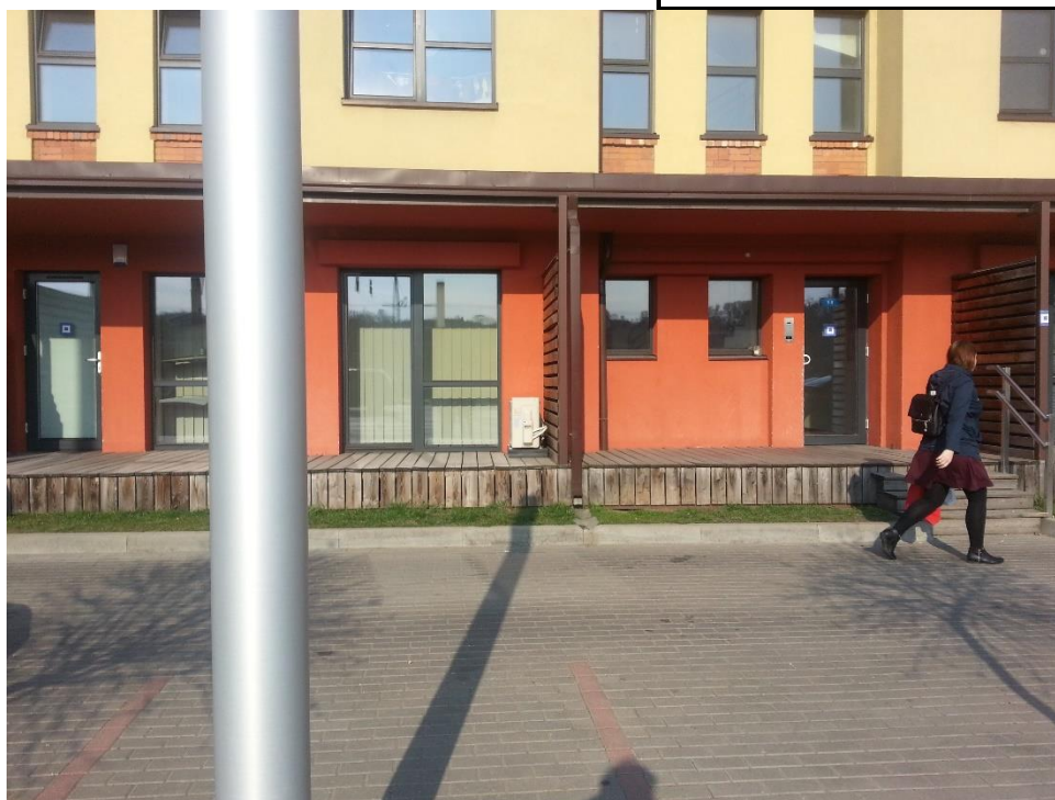
Nr. 3 Pavadinimas Pienocentro centrinės pieninės pastatų komplekso šaldytuvo pastatas PV fasado įėjimai Data 2019-04-08