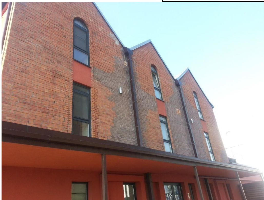
Nr. 5 Pavadinimas Pienocentro centrinės pieninės pastatų komplekso šaldytuvo pastatas PR fasadas Data 2019-04-08