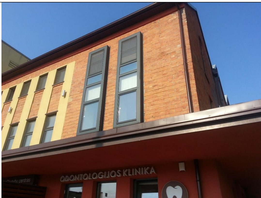
Nr. 4 Pavadinimas Pienocentro centrinės pieninės pastatų komplekso šaldytuvo pastatas PV fasado langai Data 2019-04-08