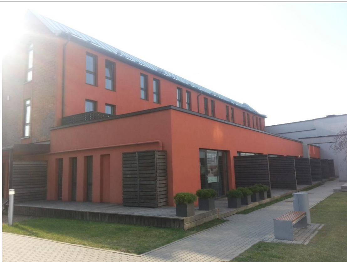
Nr. 6 Pavadinimas Pienocentro centrinės pieninės pastatų komplekso šaldytuvo pastatas ŠR fasadas Data 2019-04-08